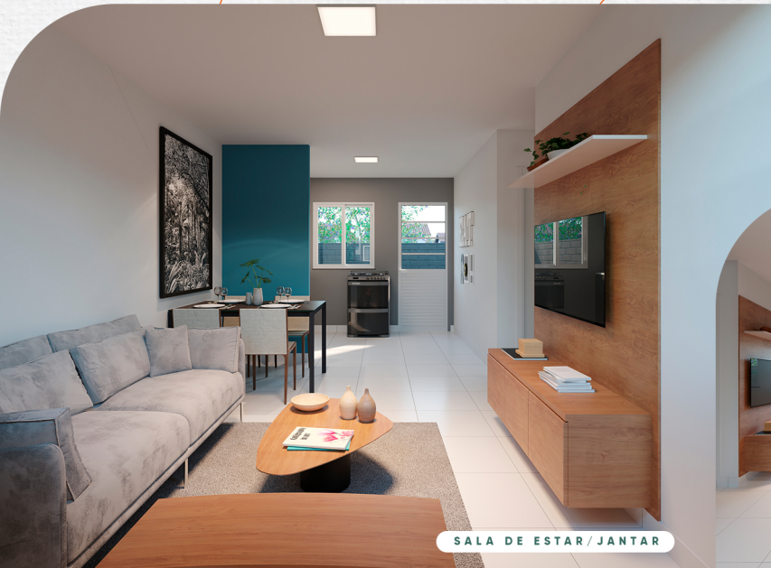
SALA DE ESTAR/JANTAR

Espaço sob medida para seus melhores dias em família.