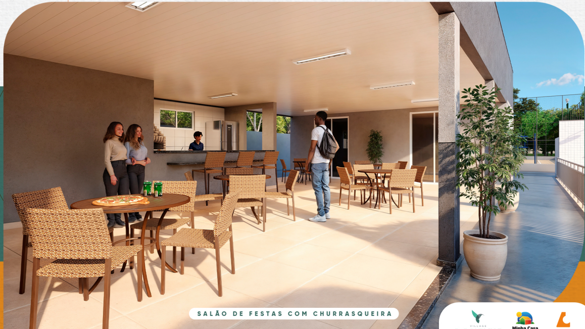
SALÃO DE FESTAS COM CHURRASQUEIRA