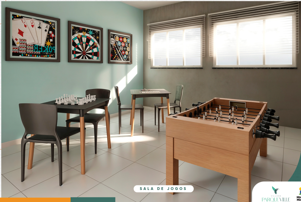
SALA DE JOGOS