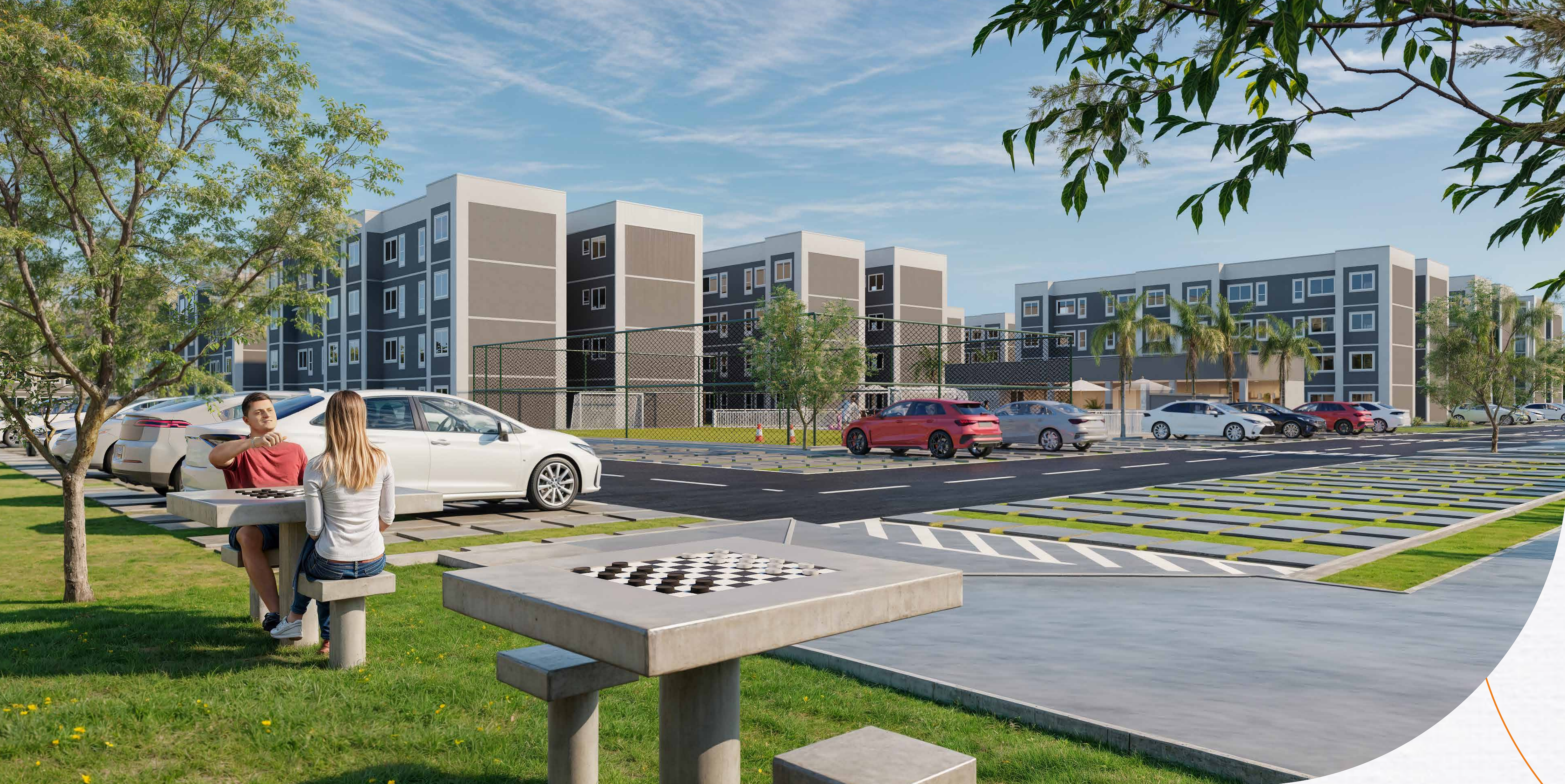
Praça de jogos