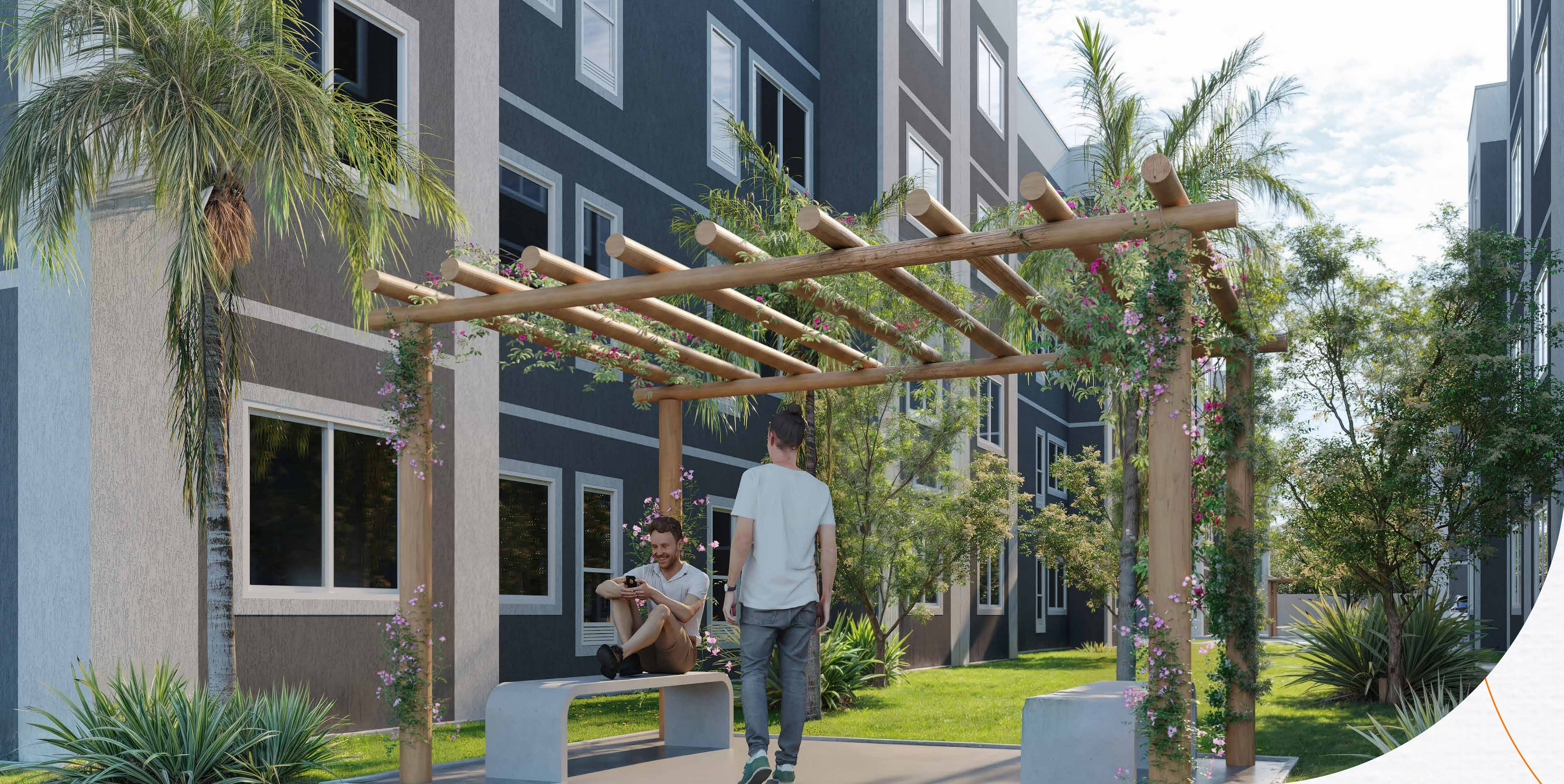
Praça com Caramanchão e bancos