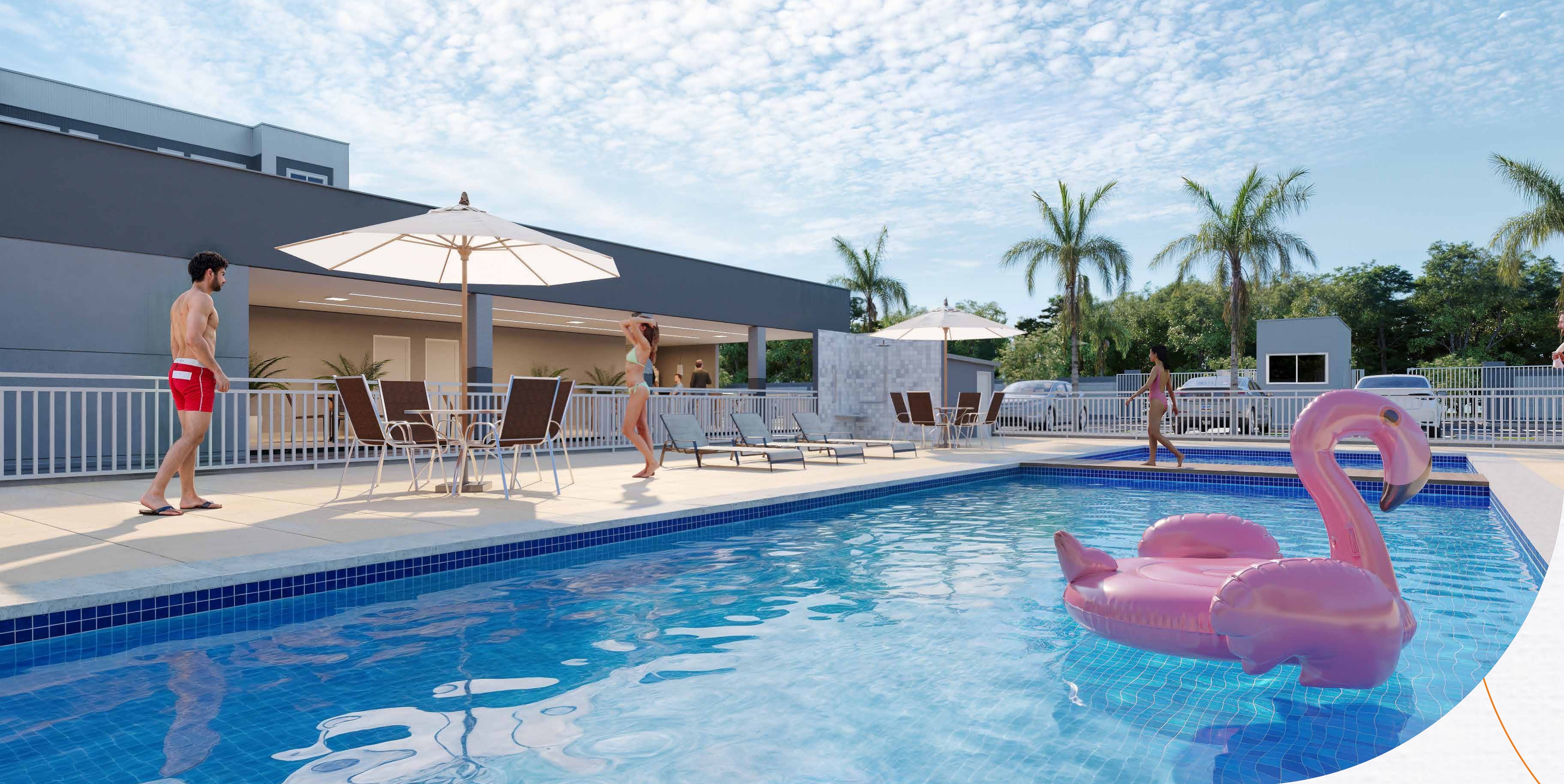
Piscinas adulto e infantil