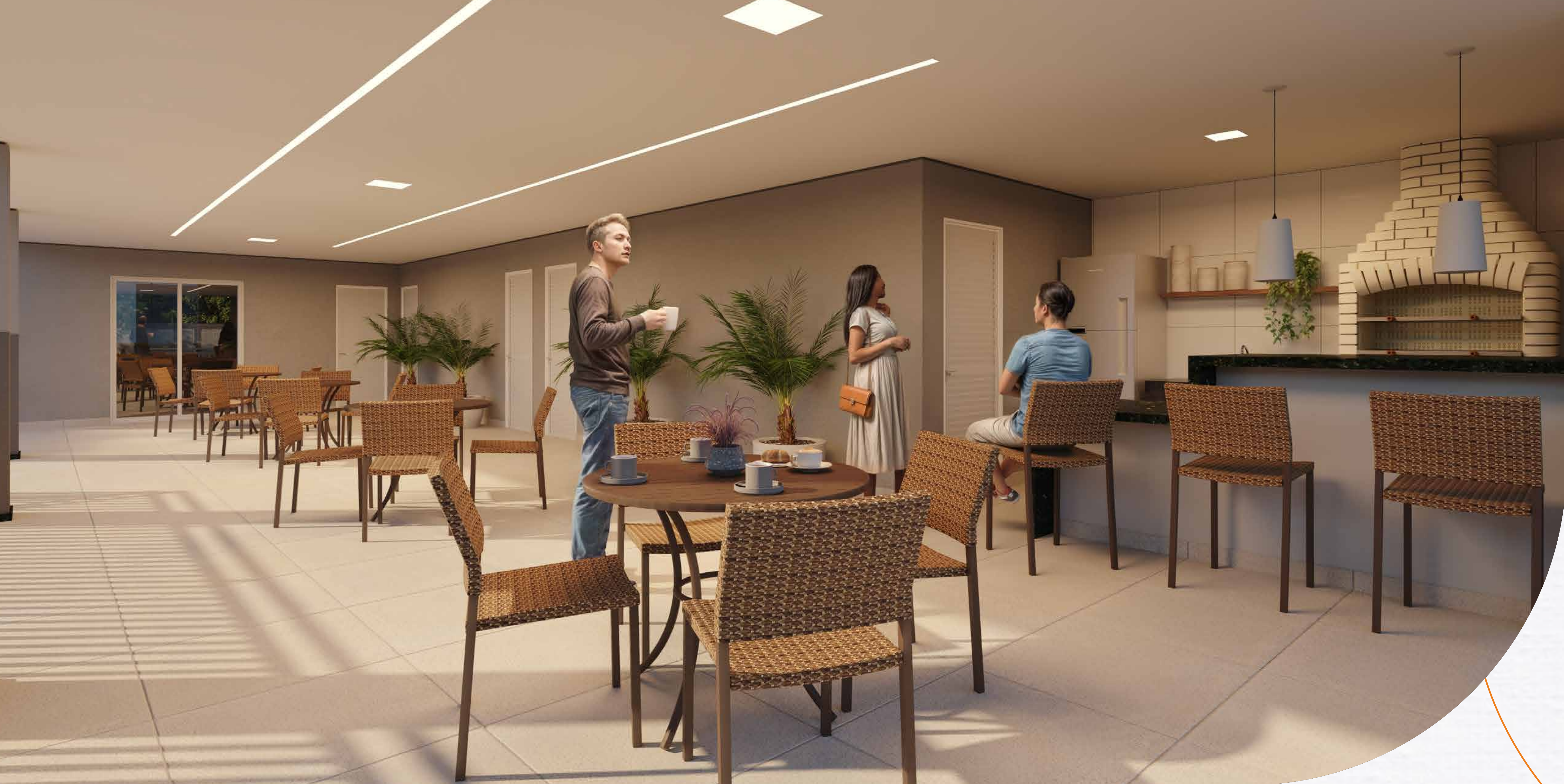
Salão de festas