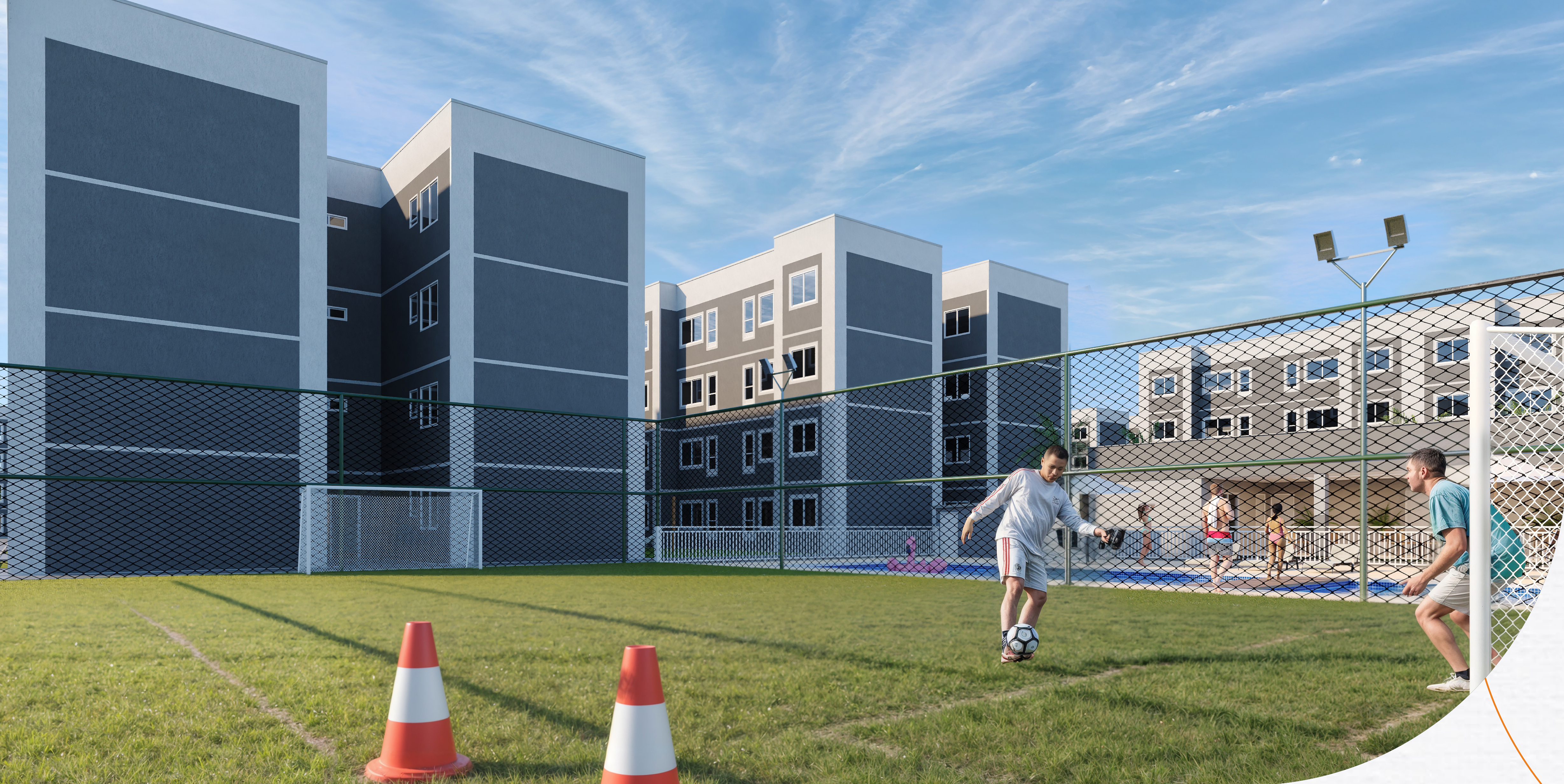
Campo de futebol