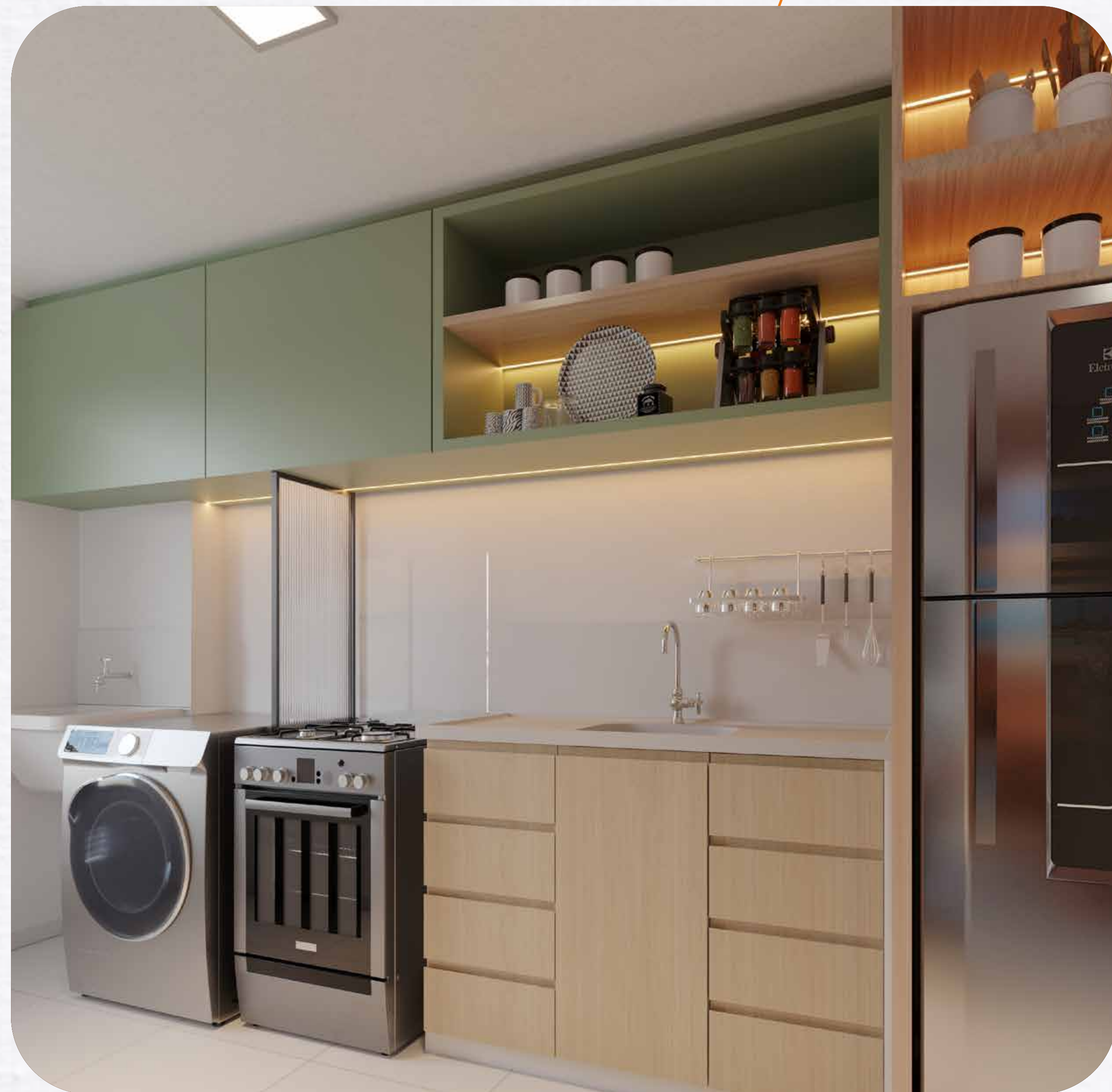
Sala e cozinha