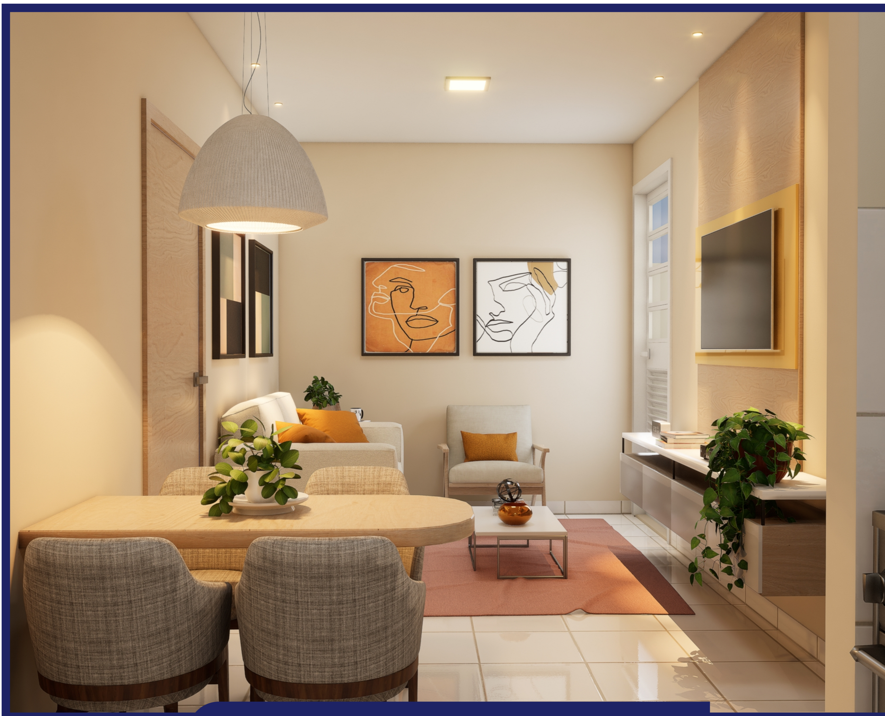
PERSPECTIVA SALA DE ESTAR/JANTAR