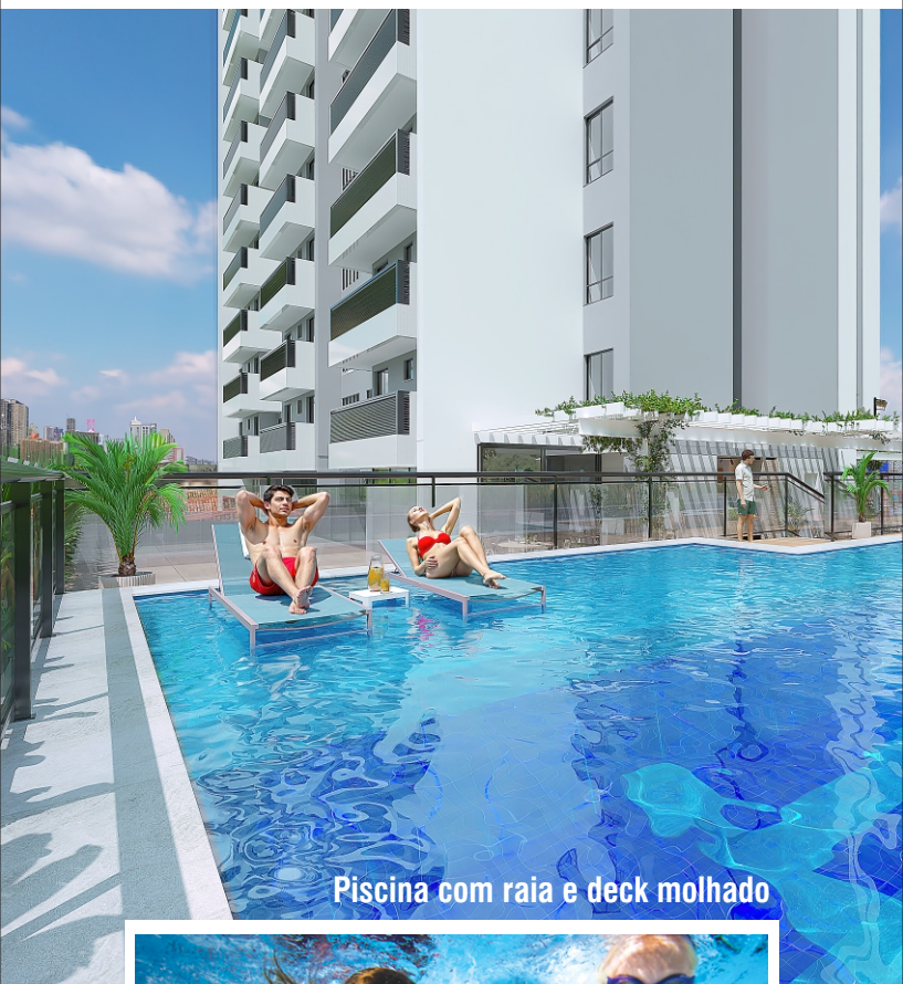
Piscina com raia e deck molhado