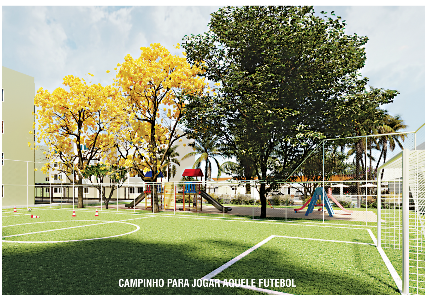
CAMPINHO PARA JOGAR AQUELE FUTEBOL