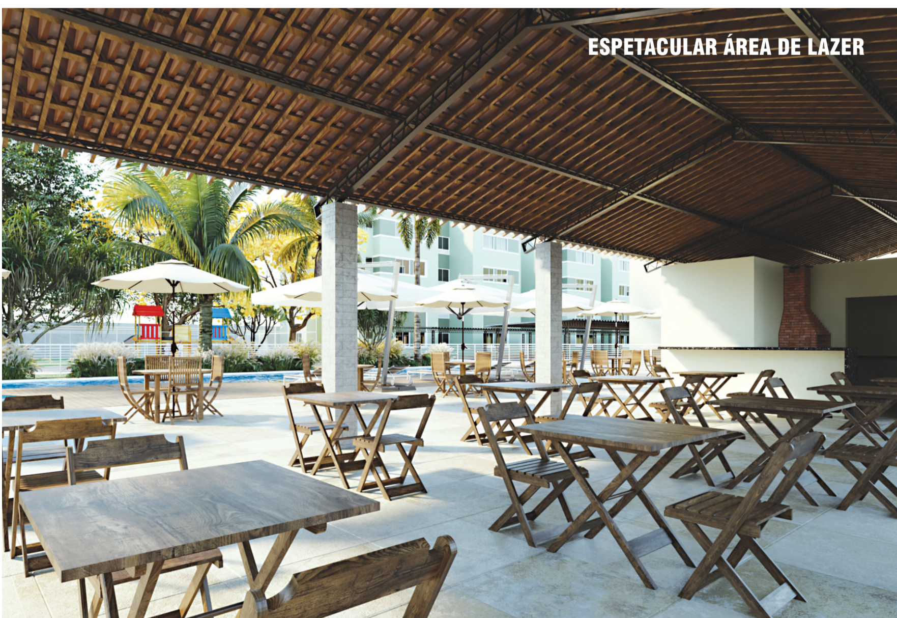
ESPETACULAR ÁREA DE LAZER