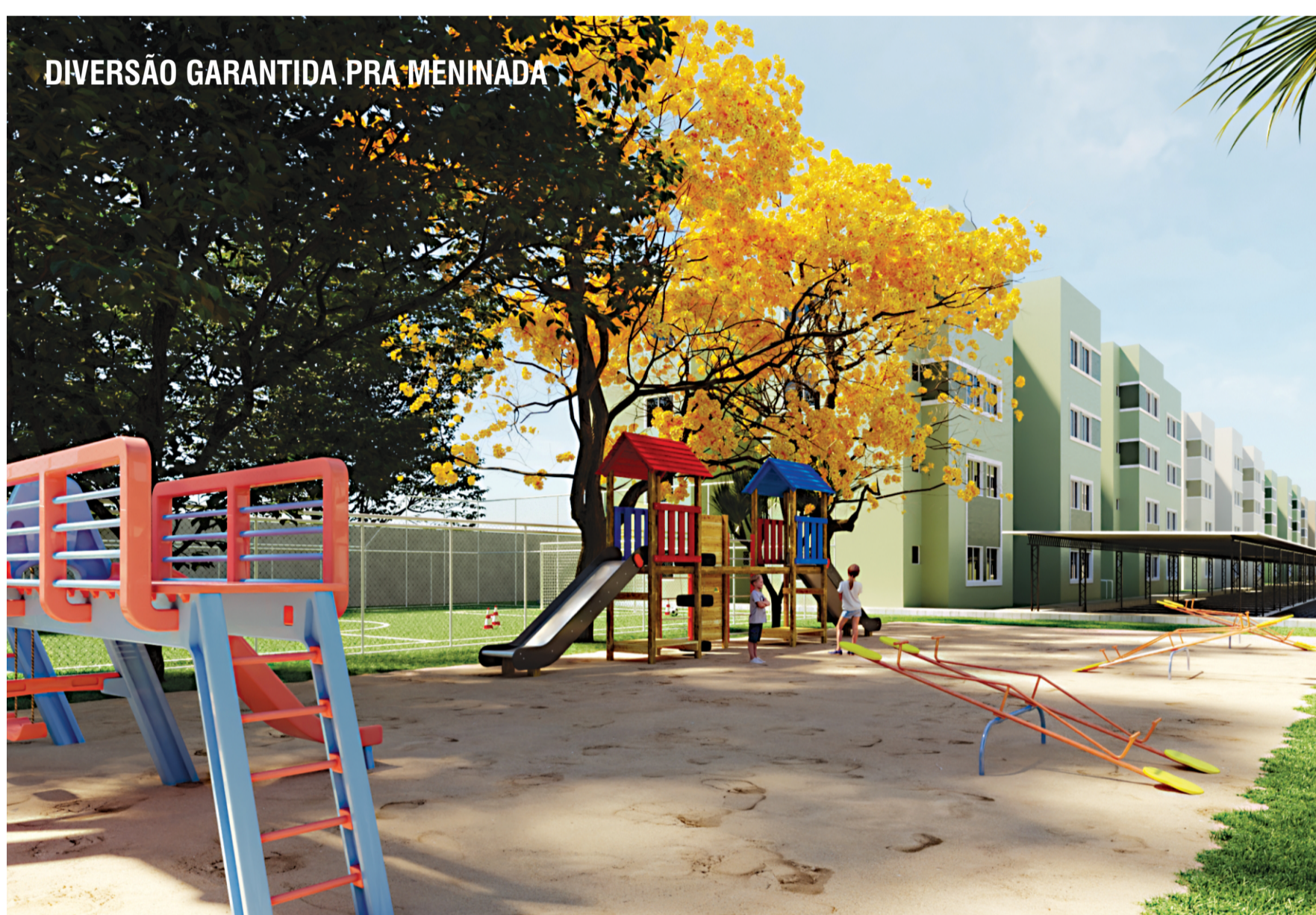
DIVERSÃO GARANTIDA PRA MENINADA