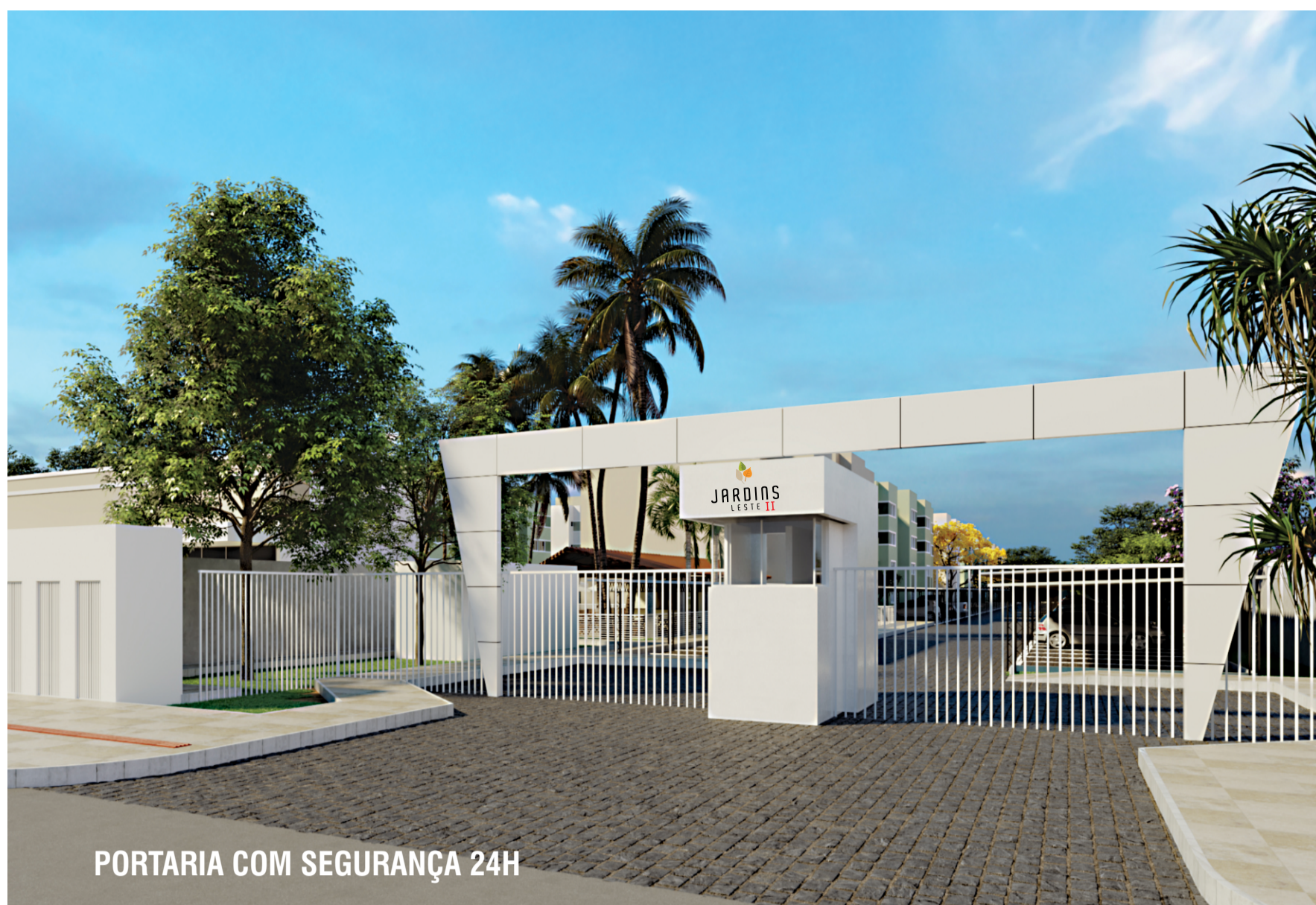
PORTARIA COM SEGURANÇA 24H