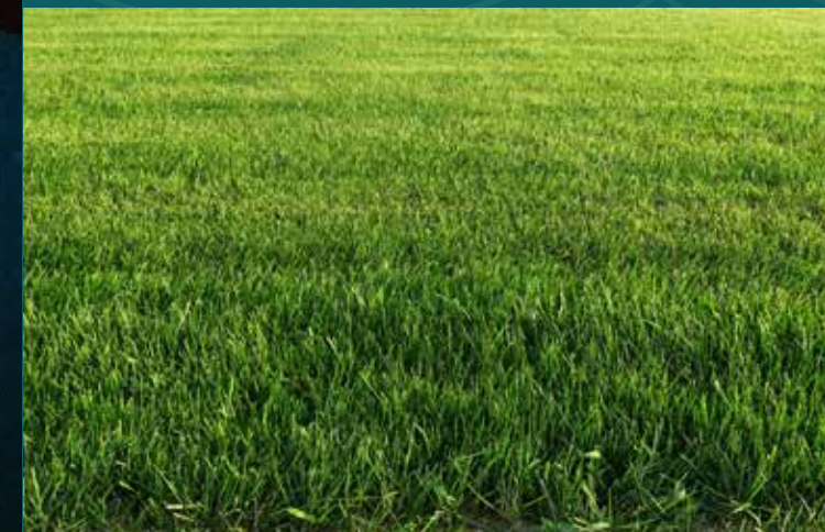
Telhado verde para uma melhor condição térmica.