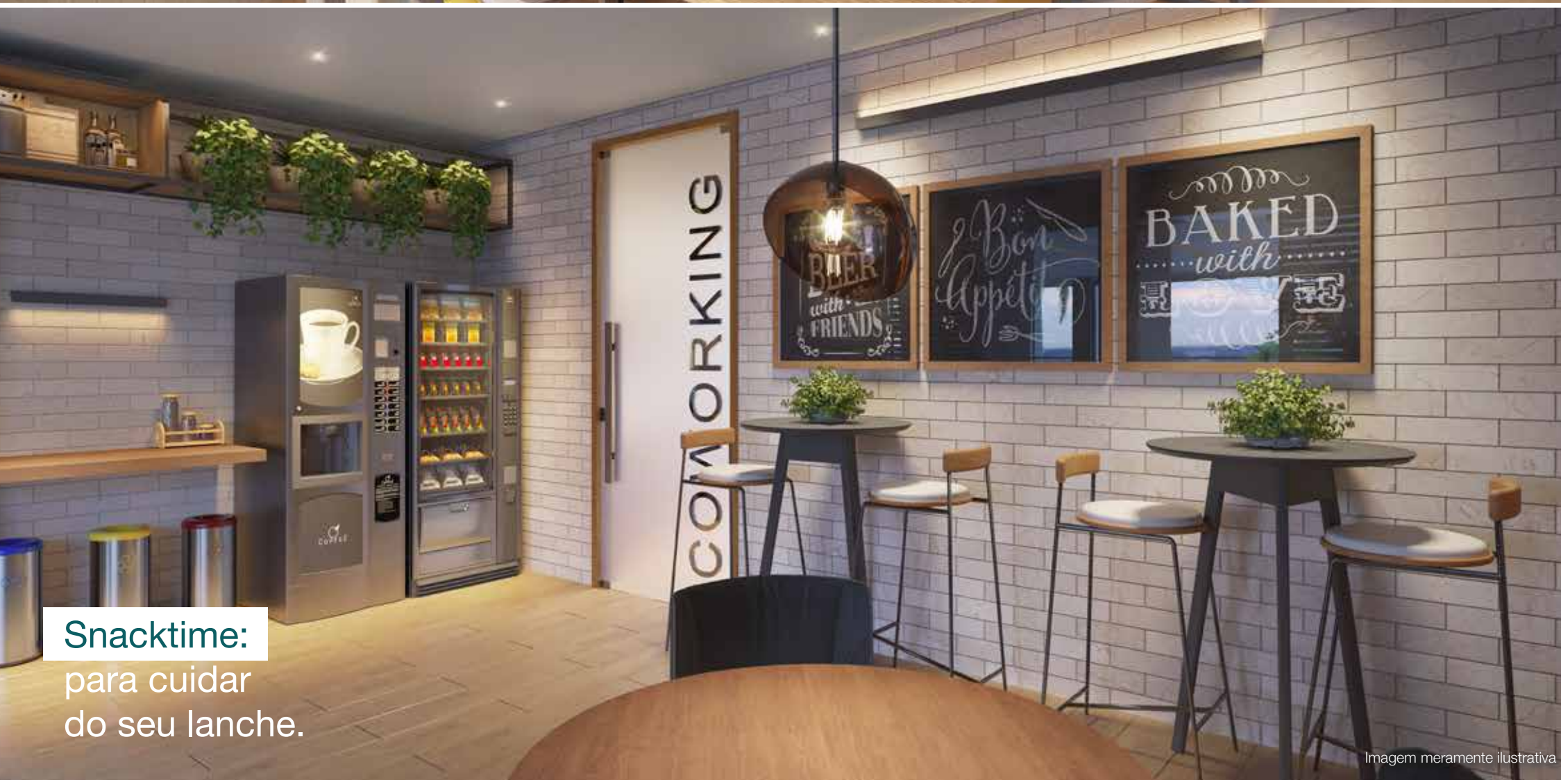
Snacktime: para cuidar do seu lanche.