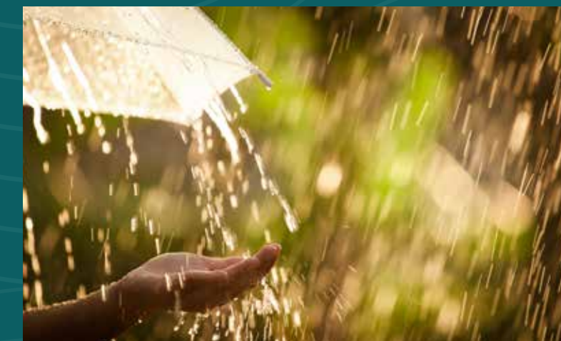
Captação e reúso de águas pluviais nas áreas comuns.