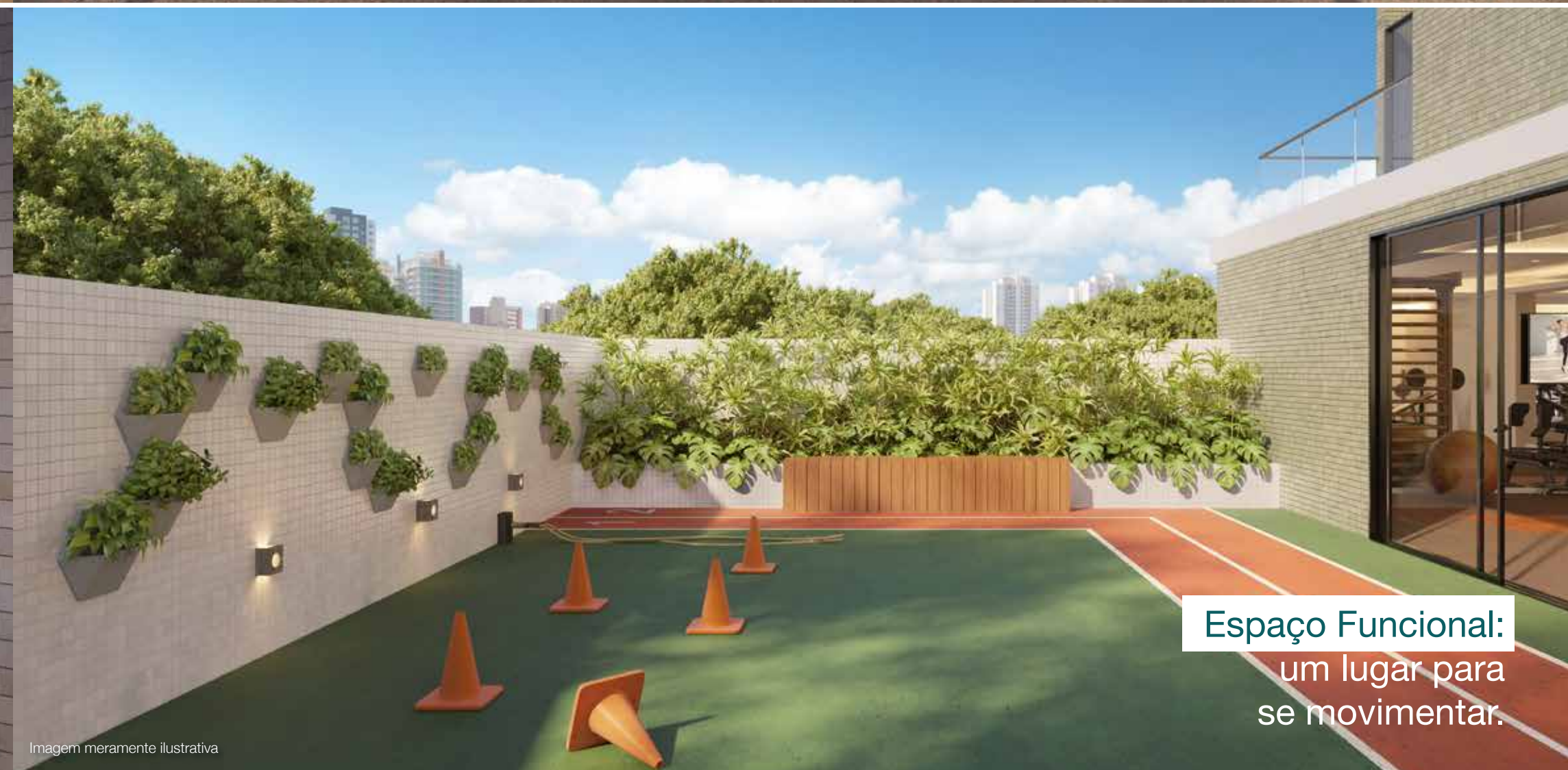
Espaço Funcional: um lugar para se movimentar.