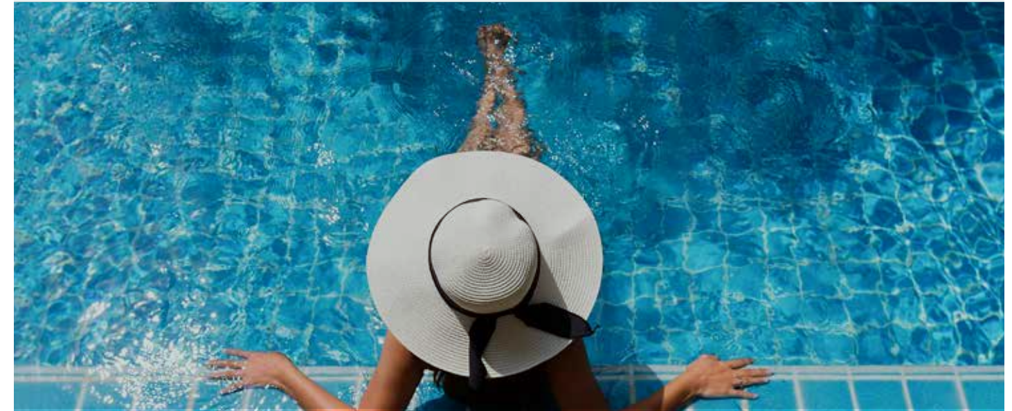
Um lugar para aproveitar o seu melhor.