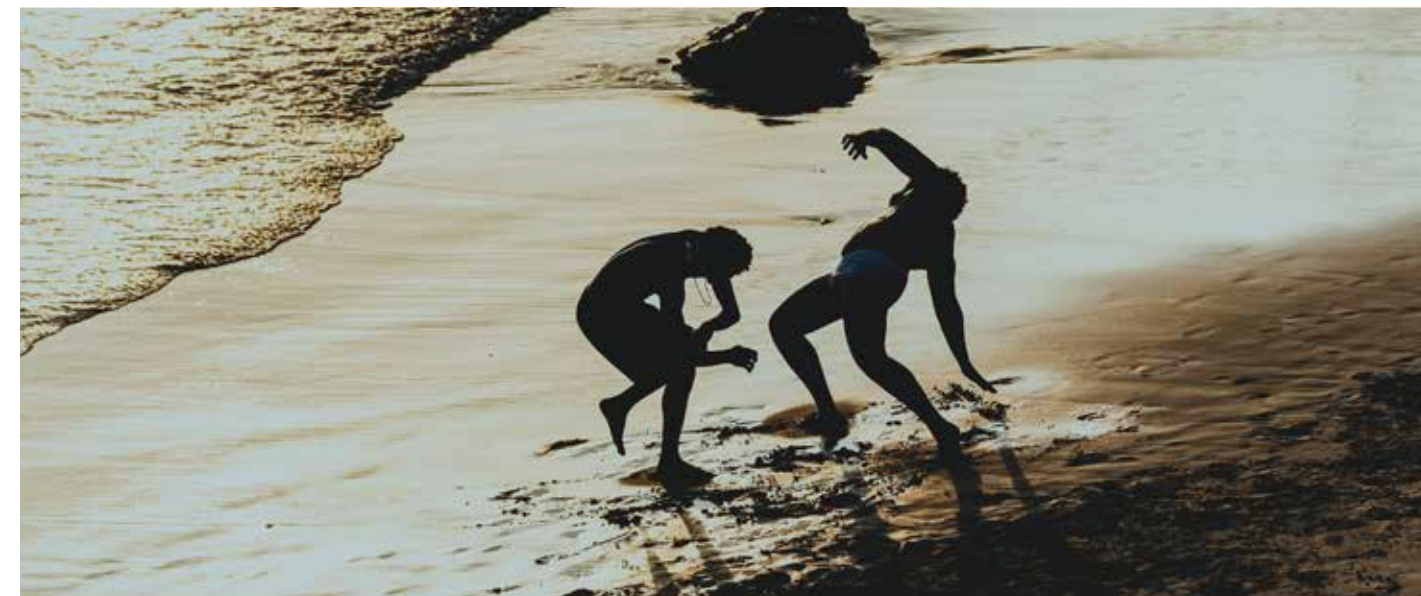
Luz azul que vem do mar.