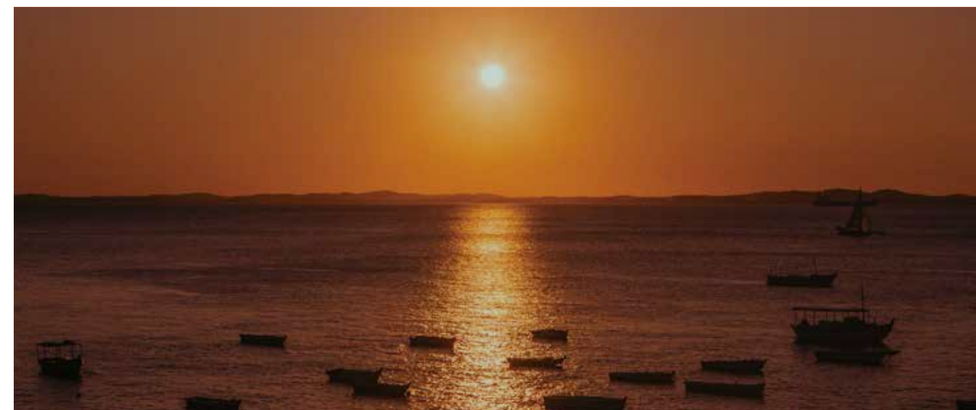
De qualquer lugar que se olha tudo faz sentido.