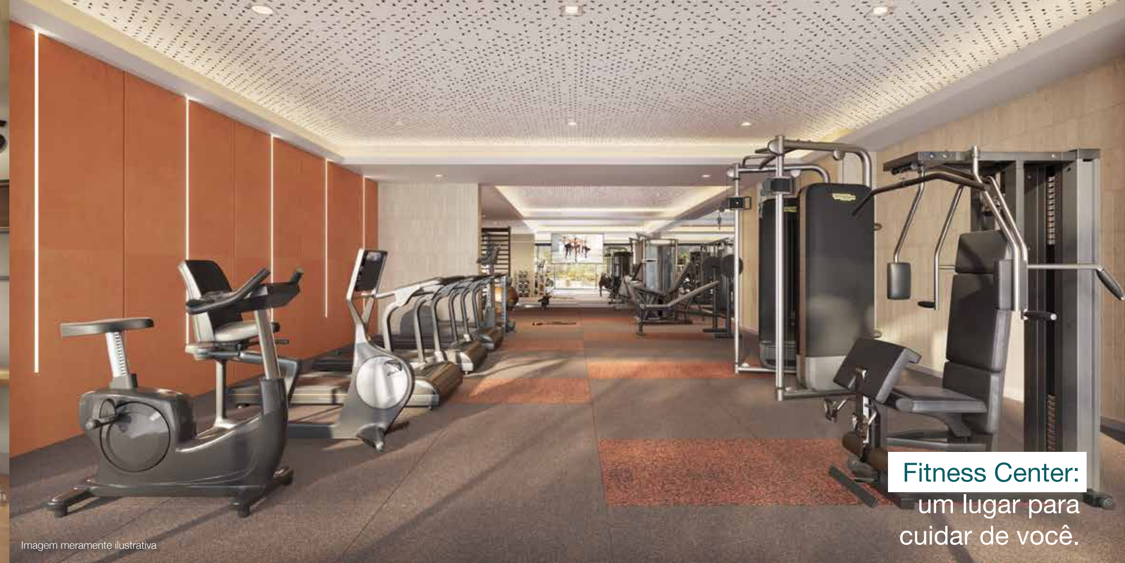
Fitness Center: um lugar para cuidar de você.