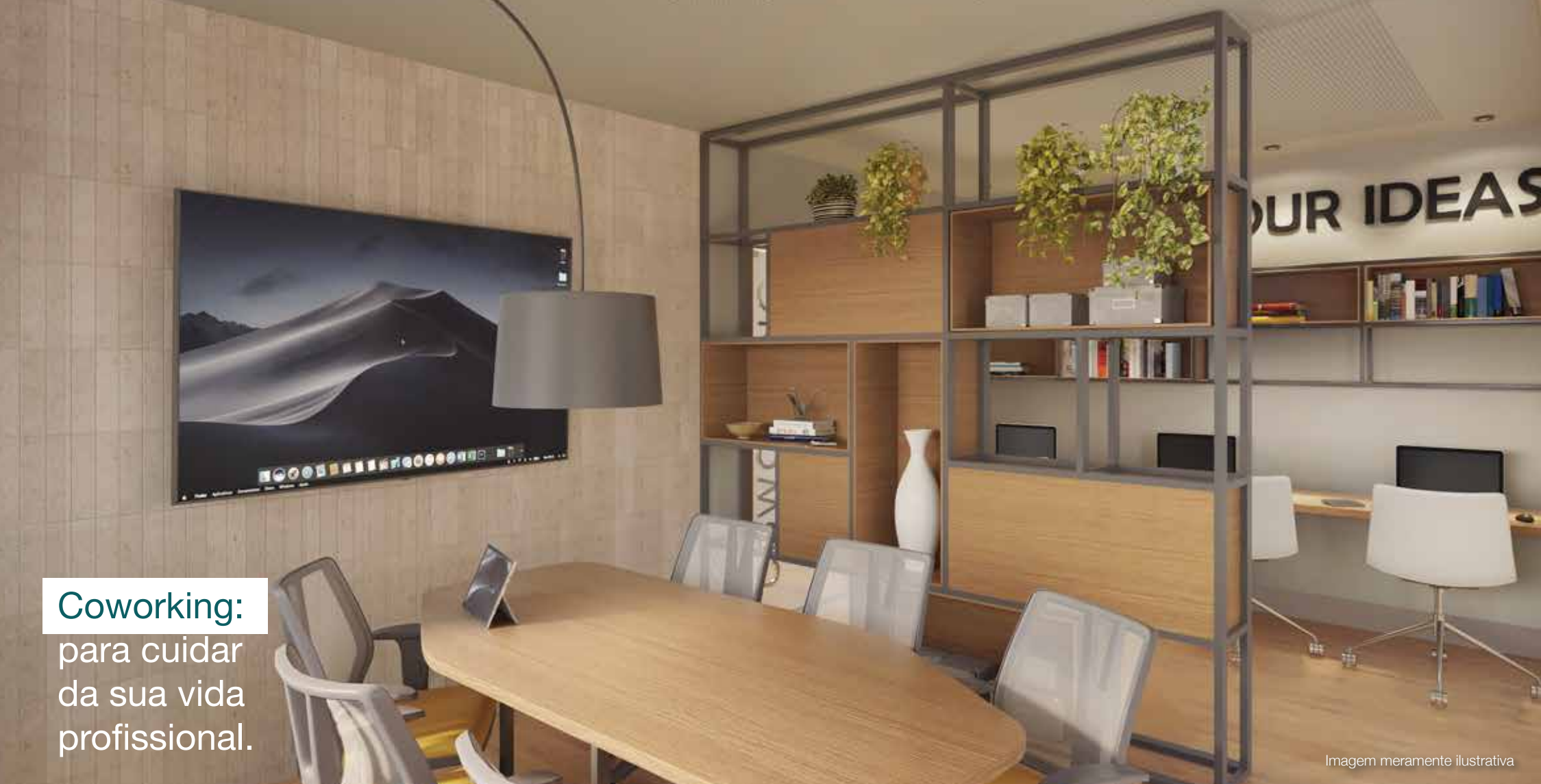
Coworking: para cuidar da sua vida profissional.