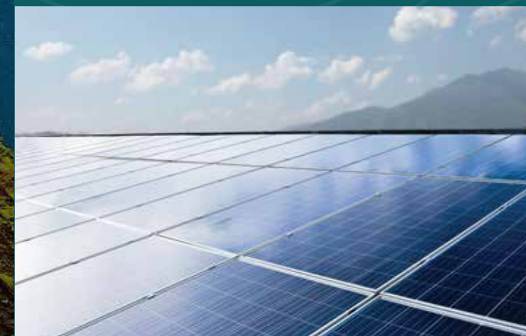
Placas fotovoltaicas para alimentação de energia das áreas comuns.