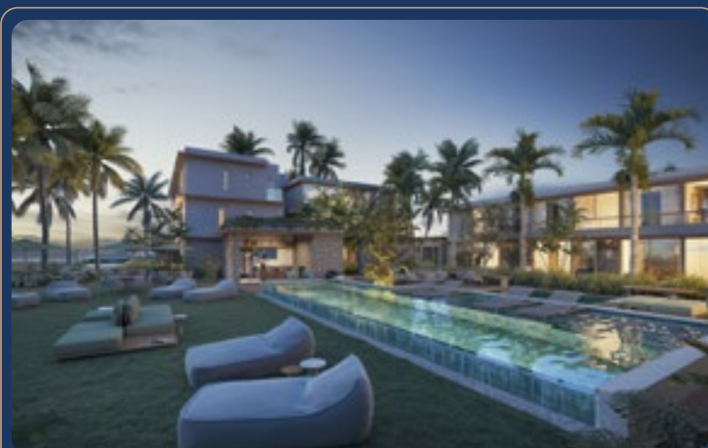
Naia • 2023