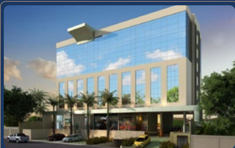
Infinity Empresarial • 2013

QUALIDADE E CREDIBILIDADE QUE CONSTROEM HISTÓRIAS DE SUCESSO.