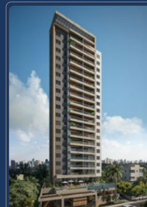
Barra Way • 2019