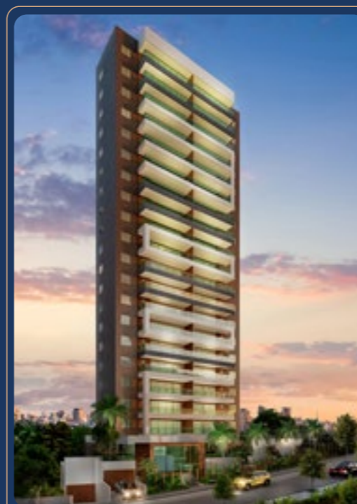
Cape Town • 2023