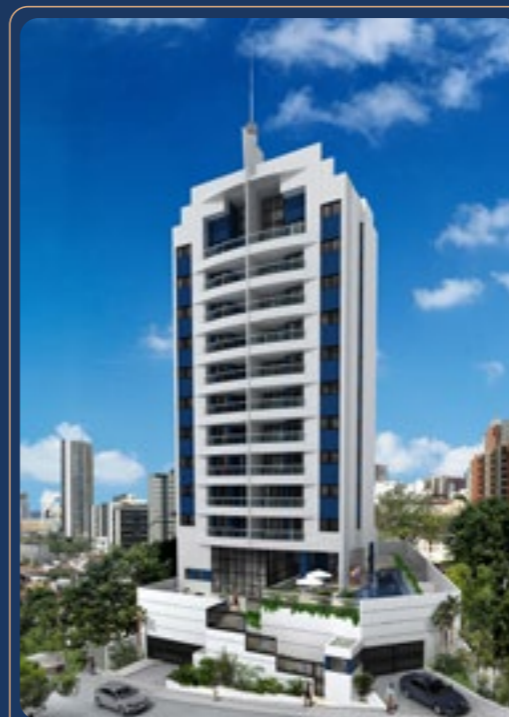
Graça Belvedere • 2010