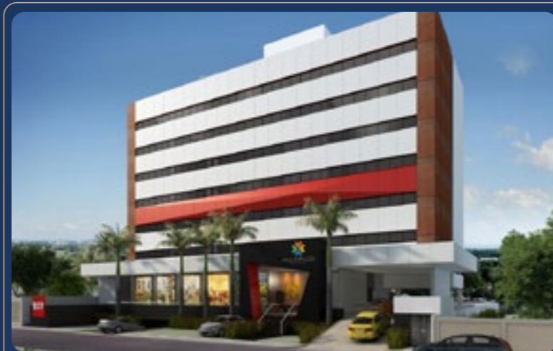
Multiplus Empresarial • 2015