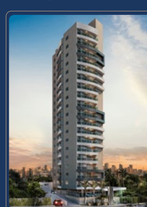
Cenarium • 2023