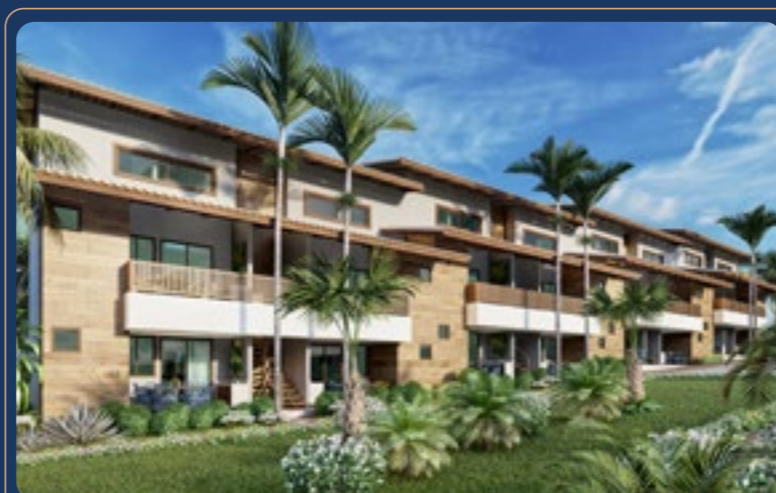
Tiê Residencial • 2023