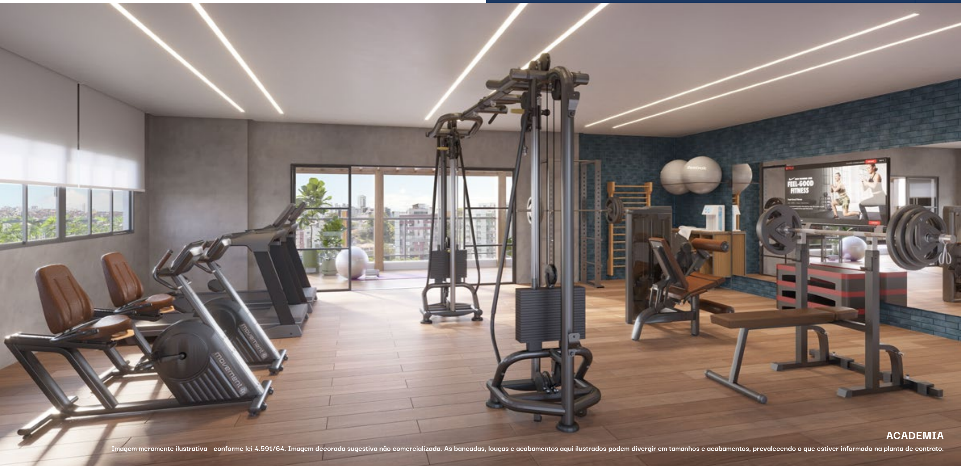
Imagem meramente ilustrativa - conforme lei 4.591/64. Imagem decorada sugestiva não comercializada. As bancadas, louças e acabamentos aqui ilustrados podem divergir em tamanhos e acabamentos, prevalecendo o que estiver informado na planta de contrato.