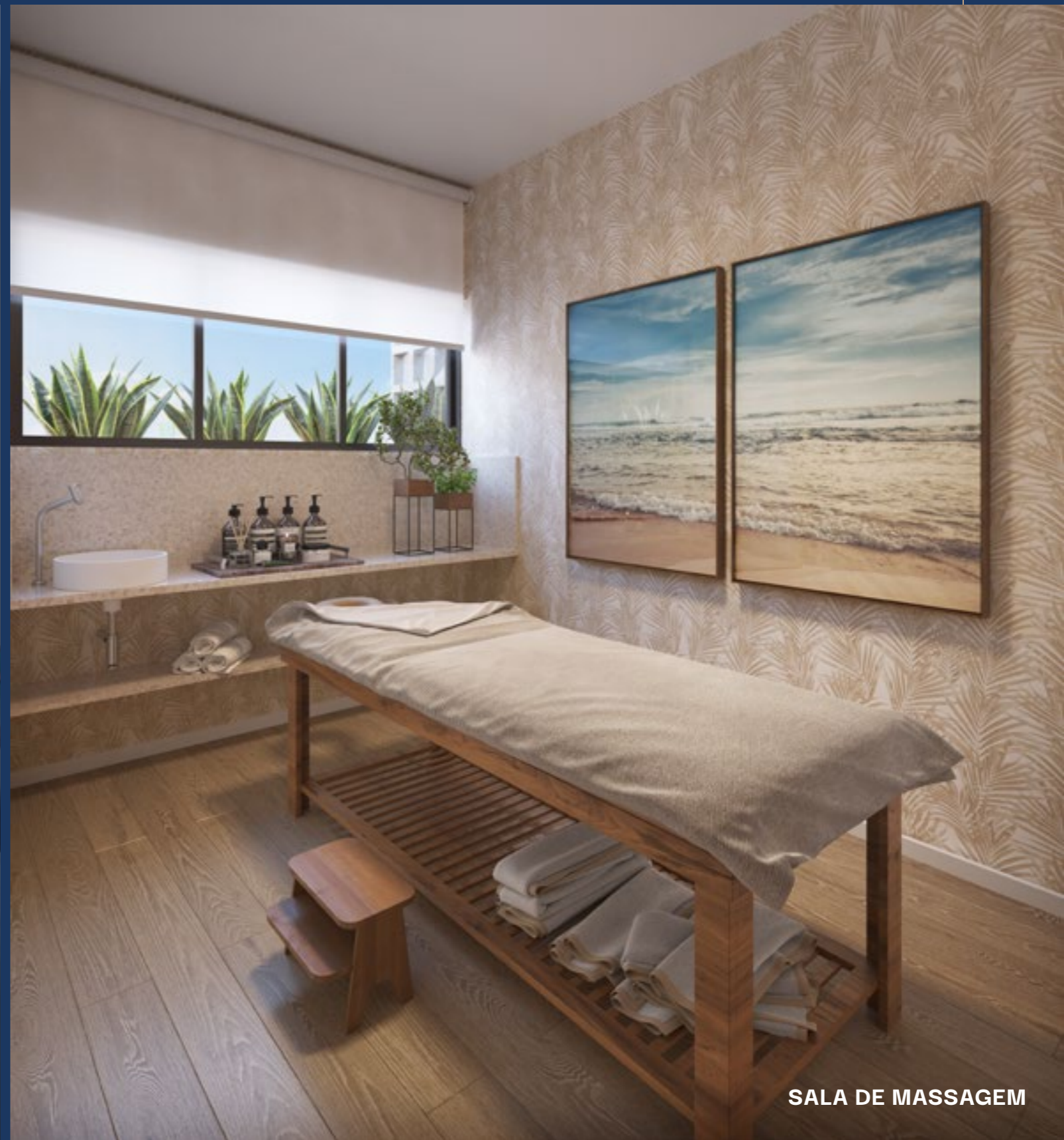
SALA DE MASSAGEM

Imagens meramente ilustrativas - conforme lei 4.591/64. Imagens decoradas sugestivas não comercializadas. As bancadas, louças e acabamentos aqui ilustrados podem divergir em tamanhos e acabamentos, prevalecendo o que estiver informado na planta de contrato.