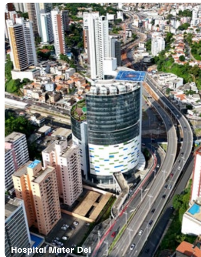
Hospital Mater Dei

TUDO O QUE VOCÊ PODE DESEJAR DE UMA LOCALIZAÇÃO, A GARIBALDI OFERECE.