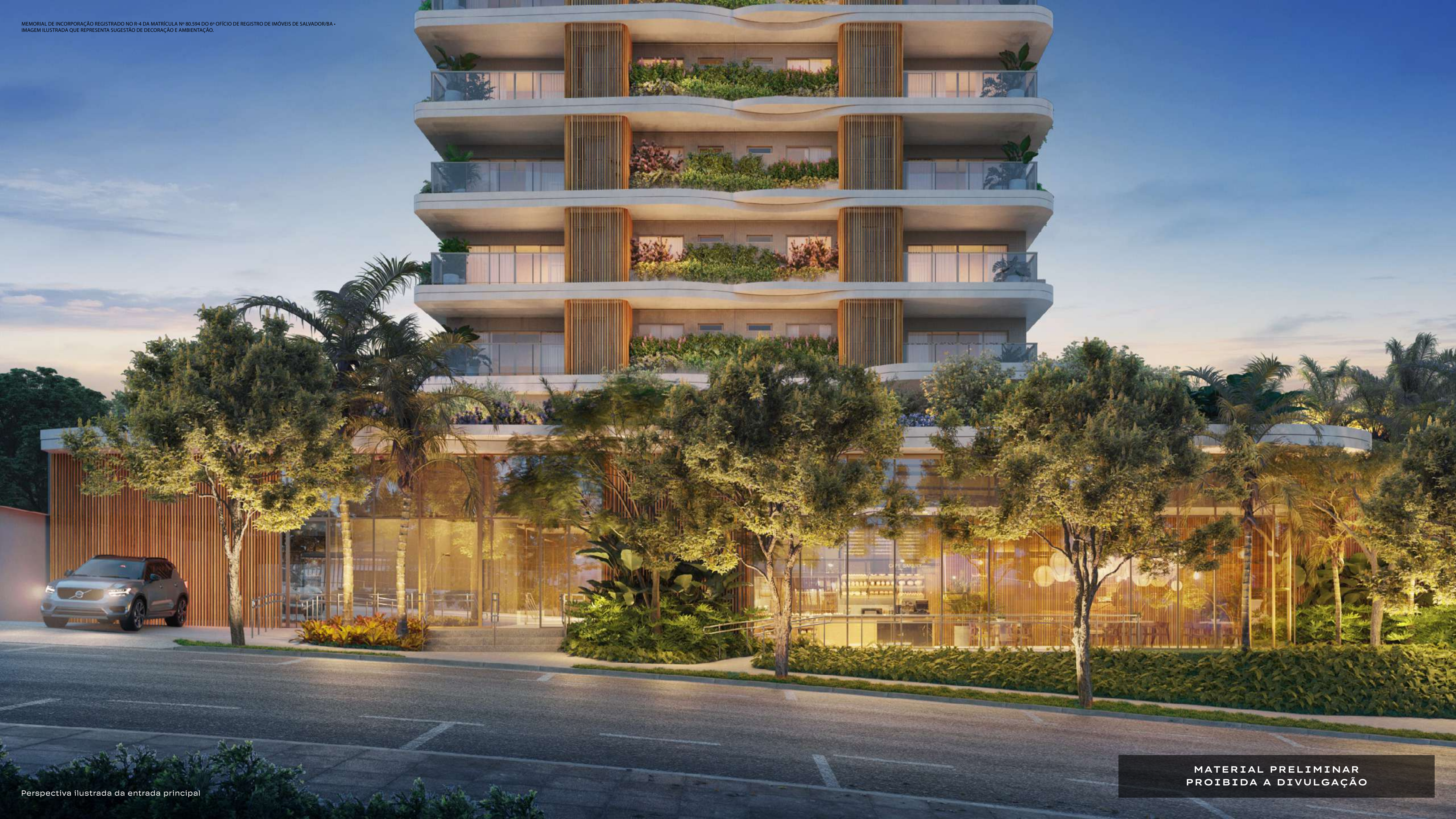
Perspectiva ilustrada da entrada principal

MATERIAL PRELIMINAR PROIBIDA A DIVULGAÇÃO