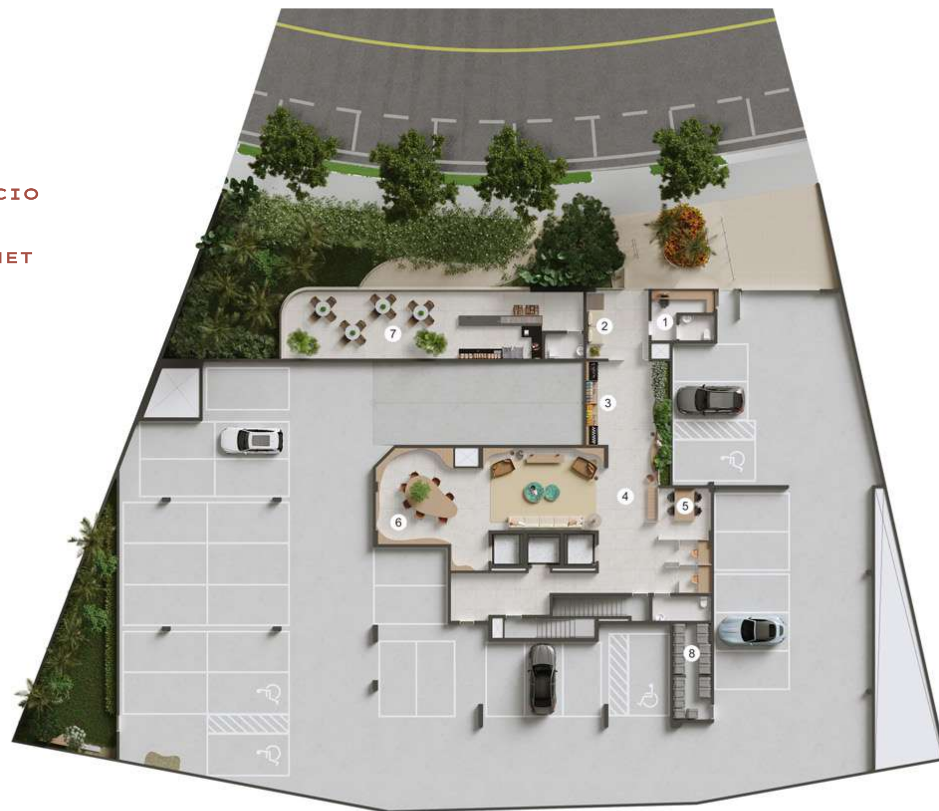
ACESSO / G1