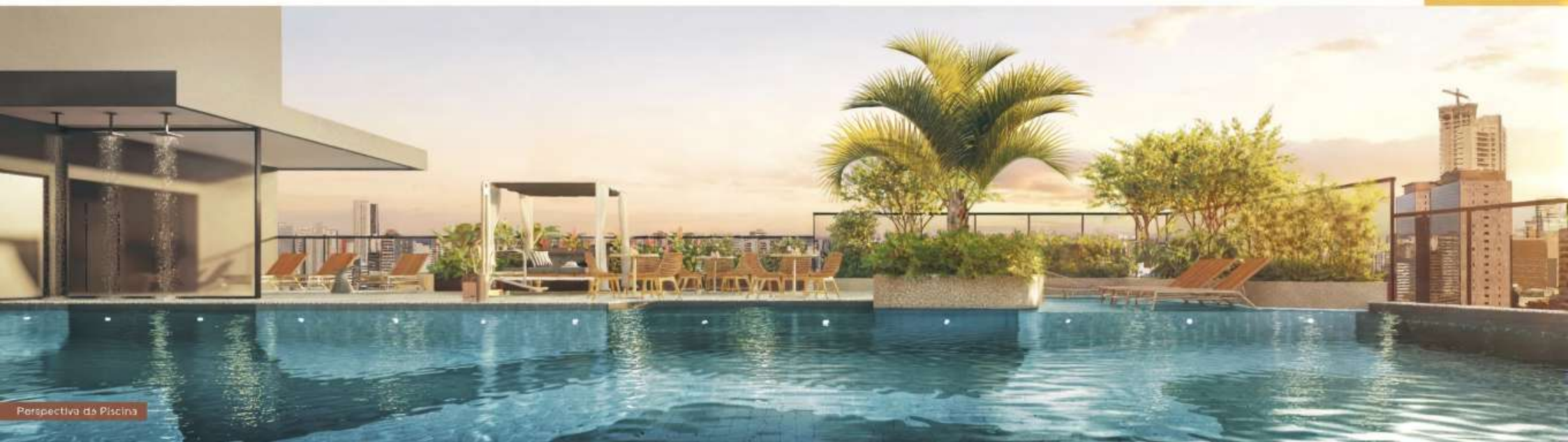
Perspectiva da Piscina