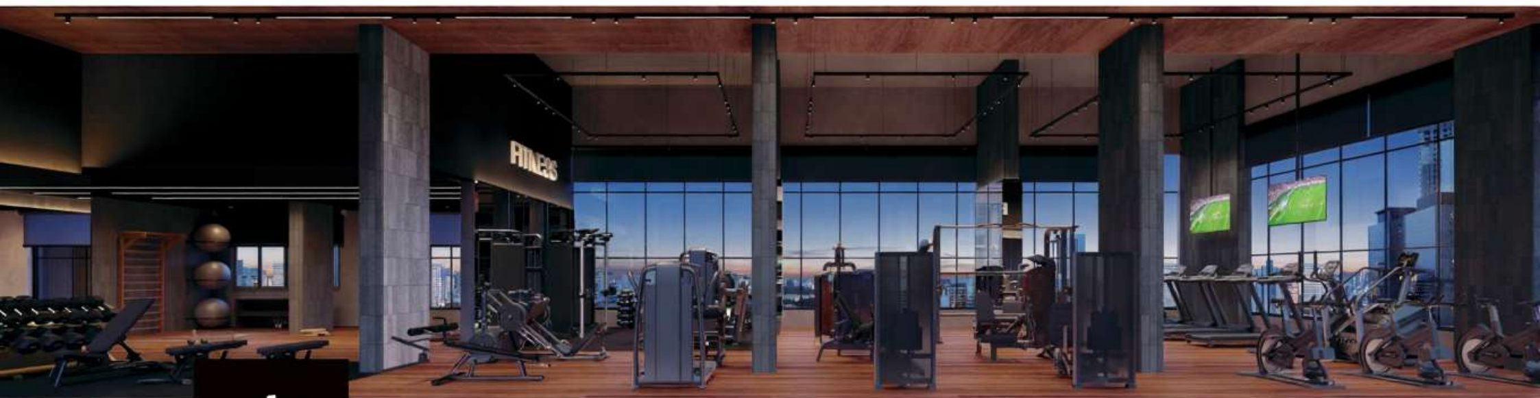
Perspectiva do fitness center