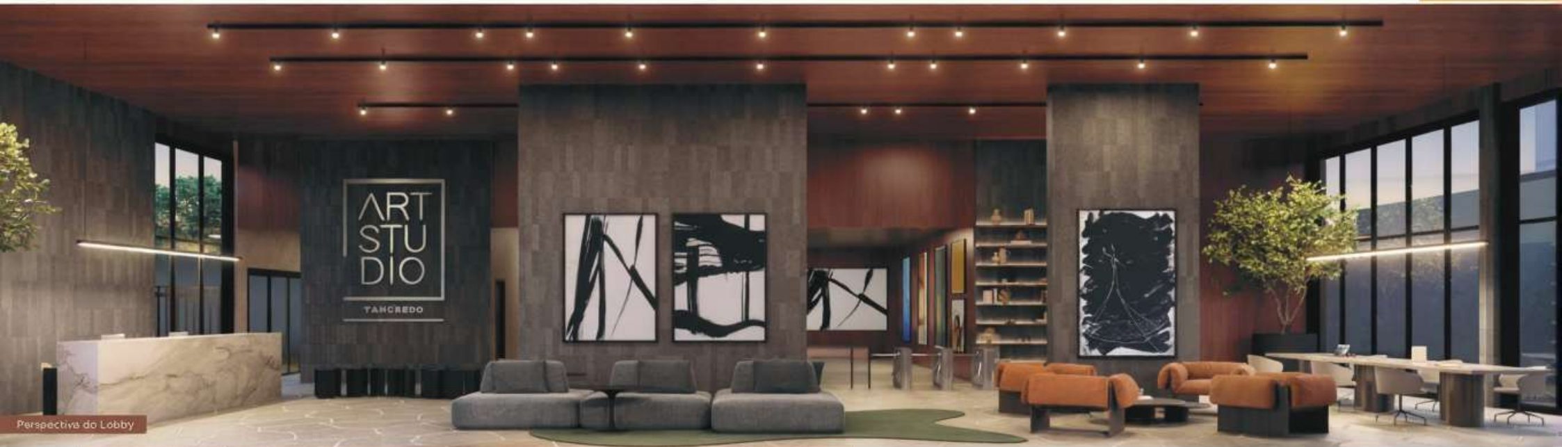
Perspectiva do Lobby