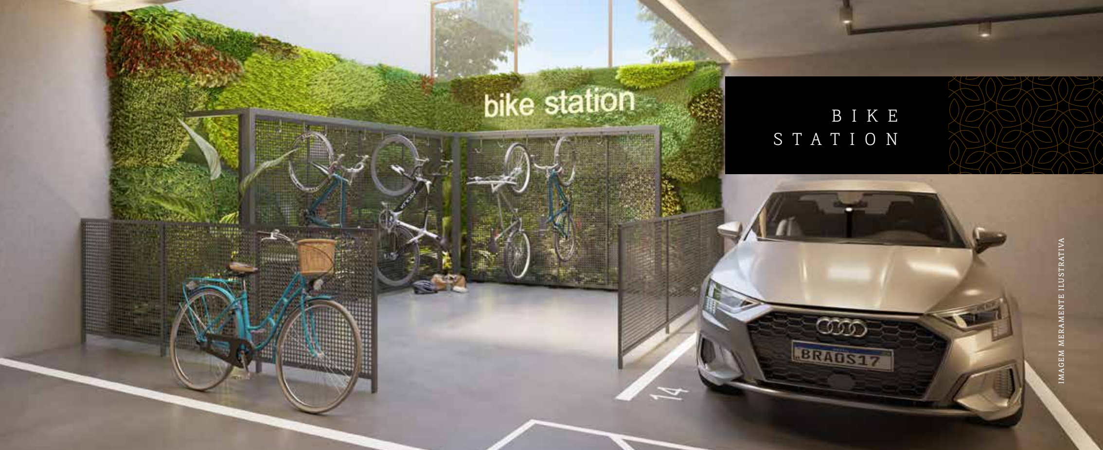
IMAGEM MEBAMENTE ILUSTRATIVA