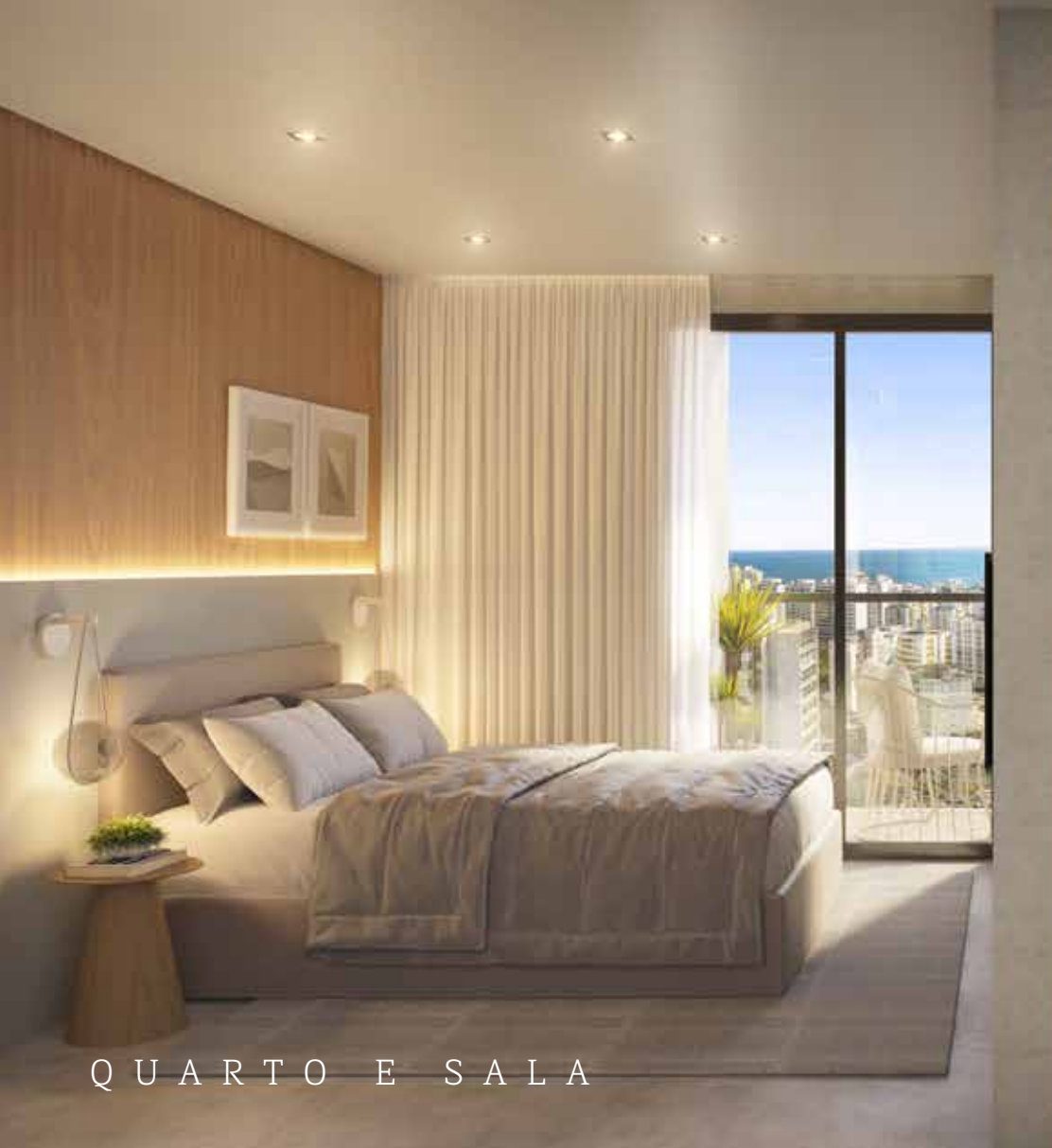
QUARTO E SALA