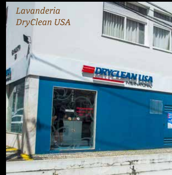
Lavanderia DryClean USA