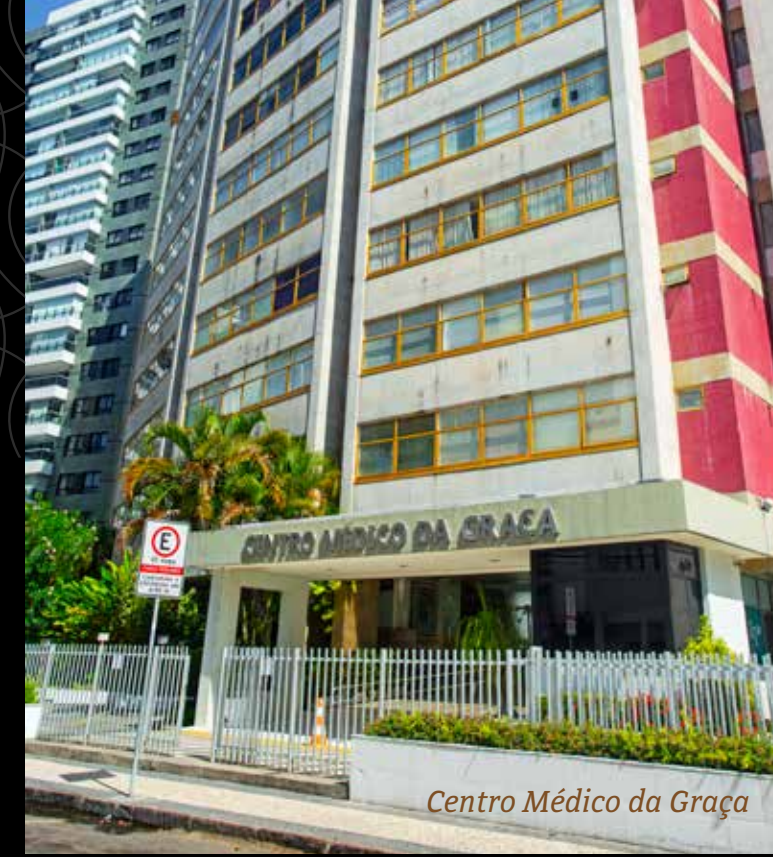
Centro Médico da Graça