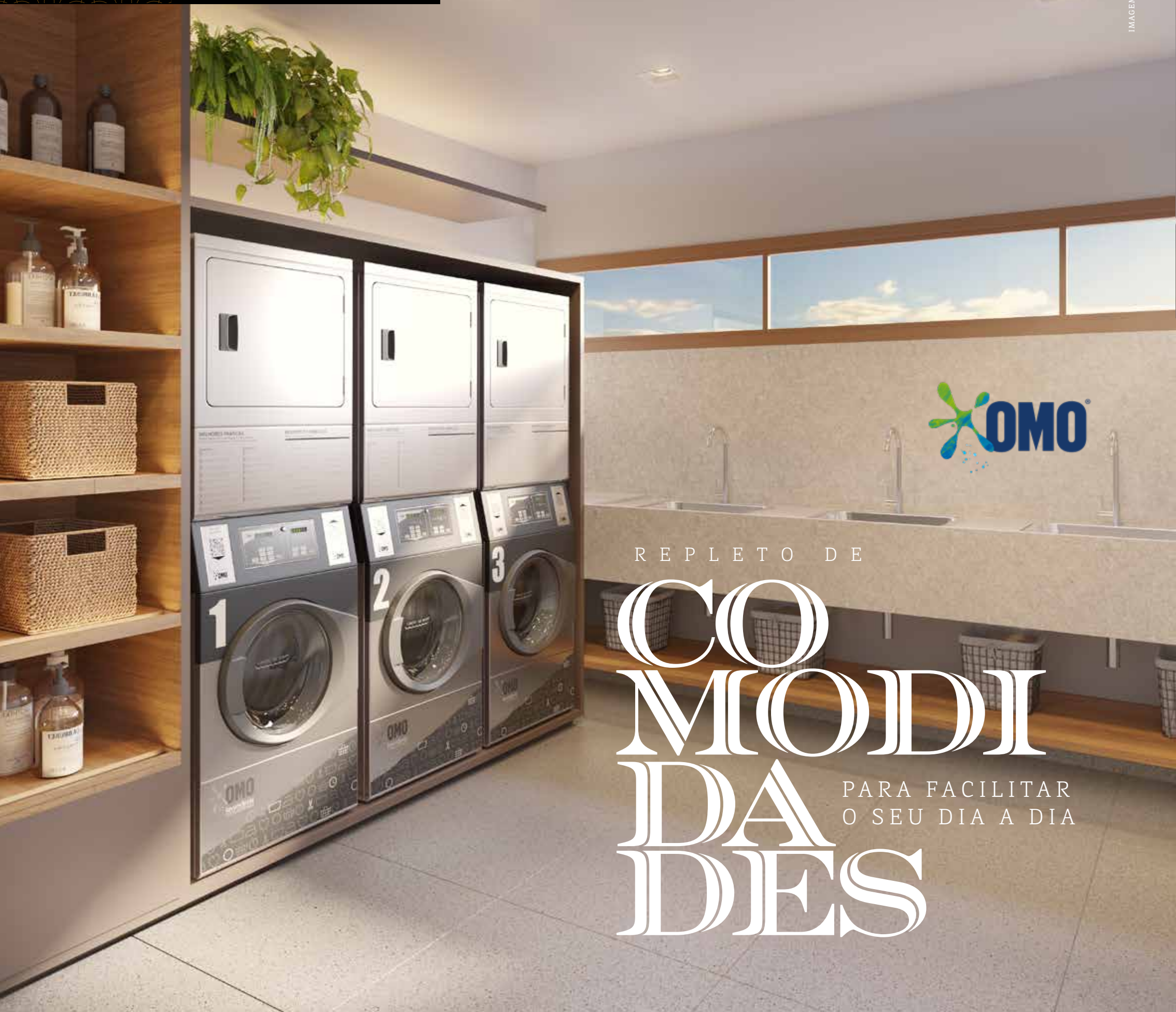
IMAGEM MEBAMENTE ILUSTRATIVA

REPLETO DE COMODIDADES PARA FACILITAR O SEU DIA A DIA