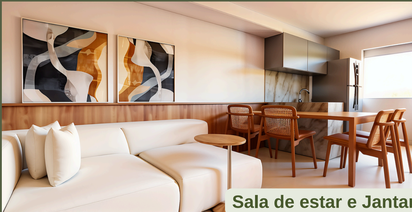
Sala de estar e Jantar