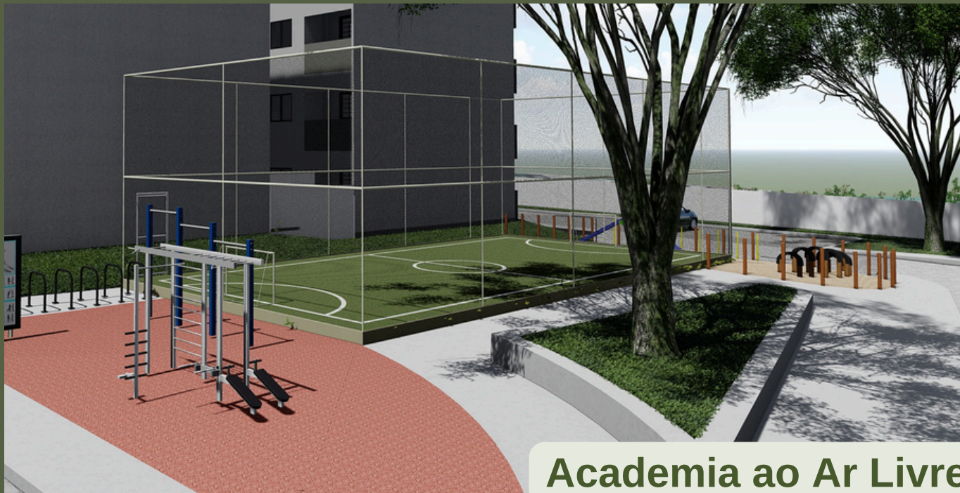
Academia ao Ar Livre