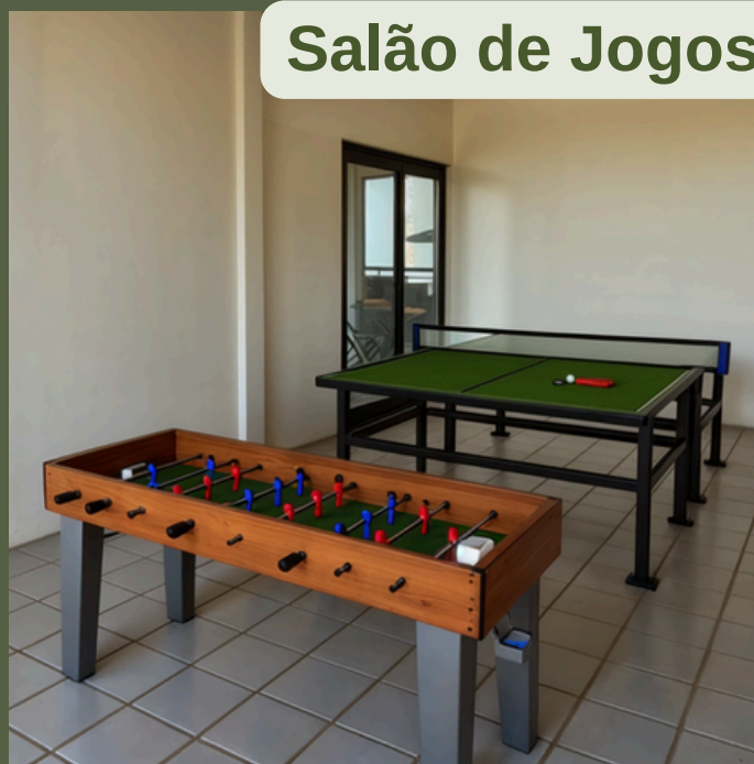
Salão de Jogos