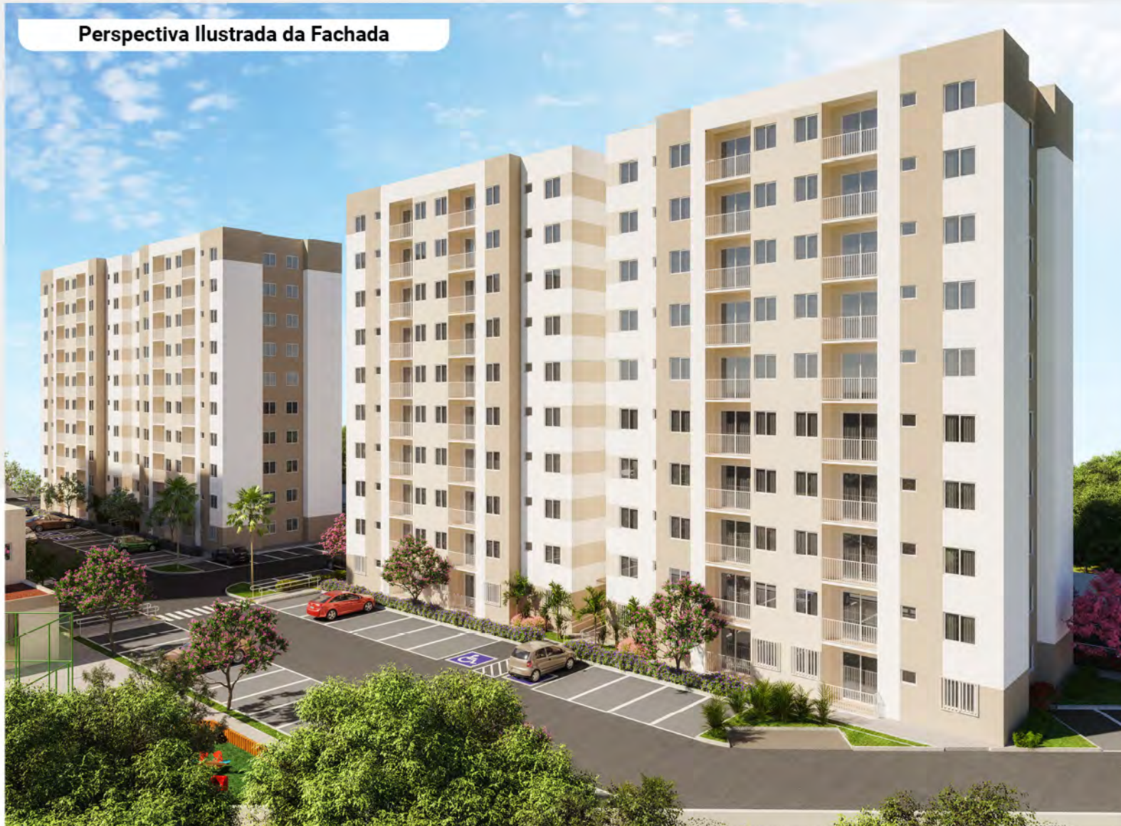
Perspectiva Ilustrada da Fachada