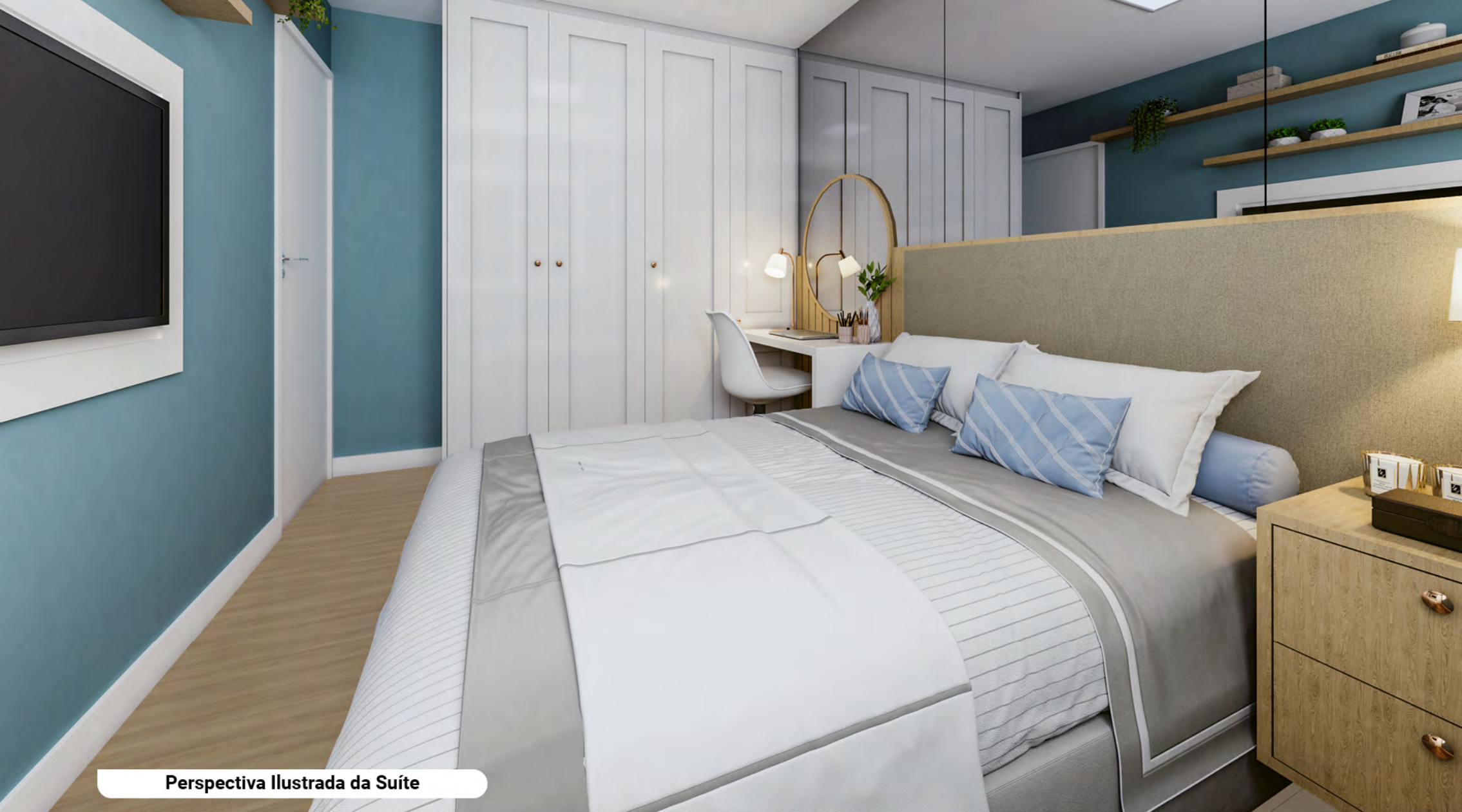
Perspectiva Ilustrada da Suíte