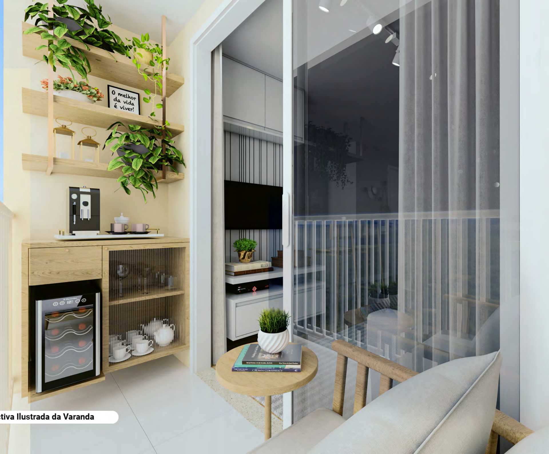
Perspectiva Ilustrada da Varanda