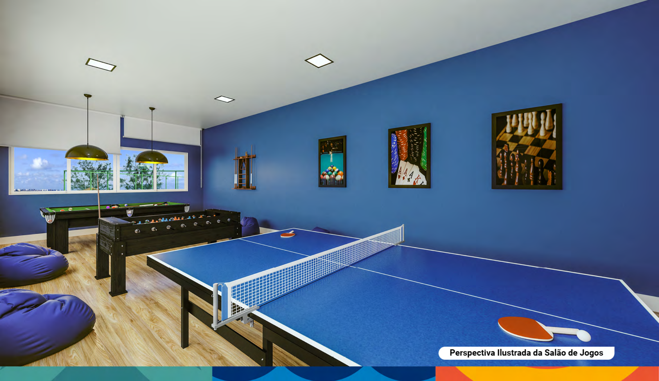
Perspectiva Ilustrada da Salão de Jogos