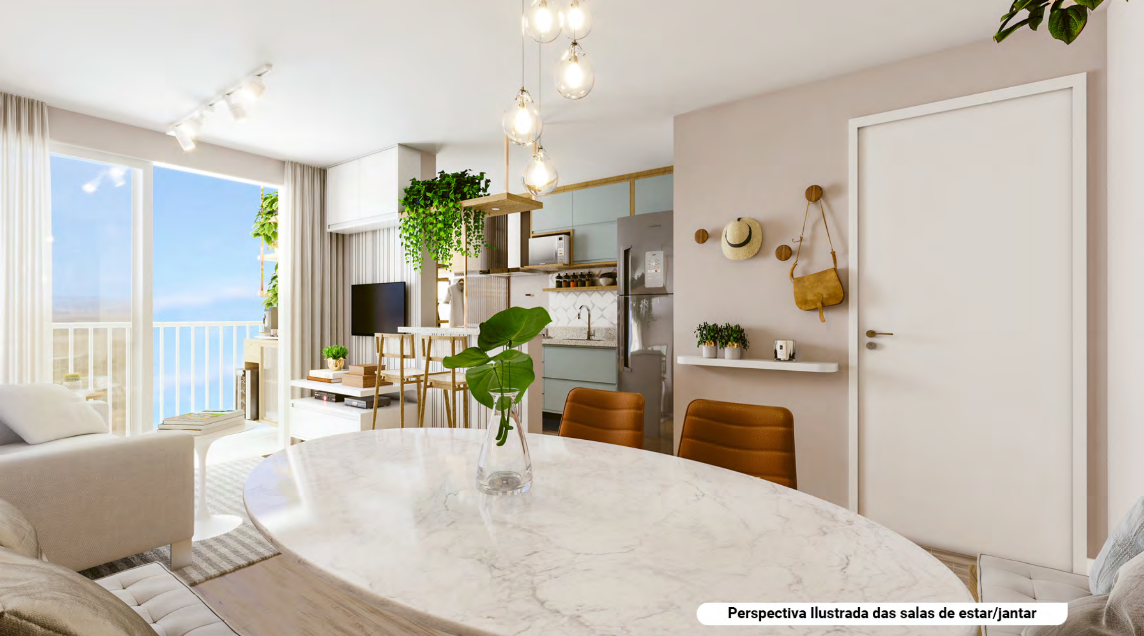
Perspectiva Ilustrada das salas de estar/jantar