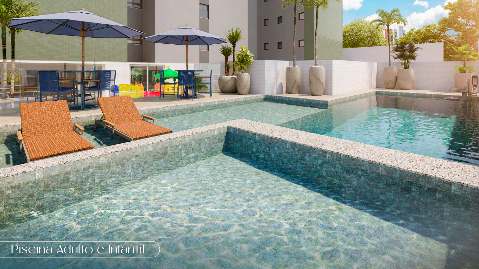
Piscina Adulto e Infantil