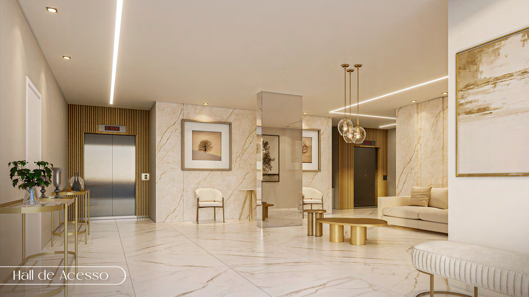
Hall de Acesso