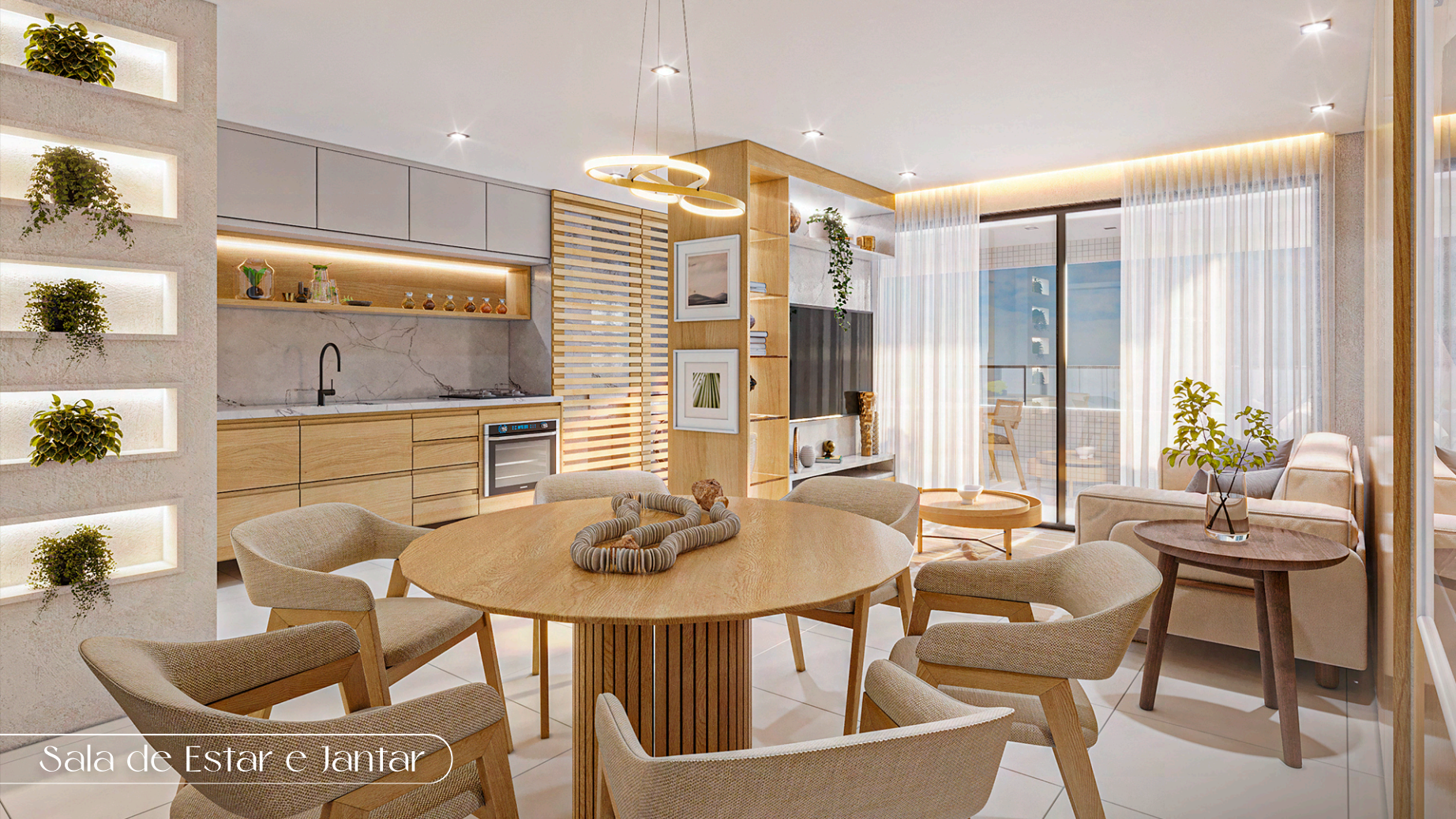
Sala de Estar e Jantar