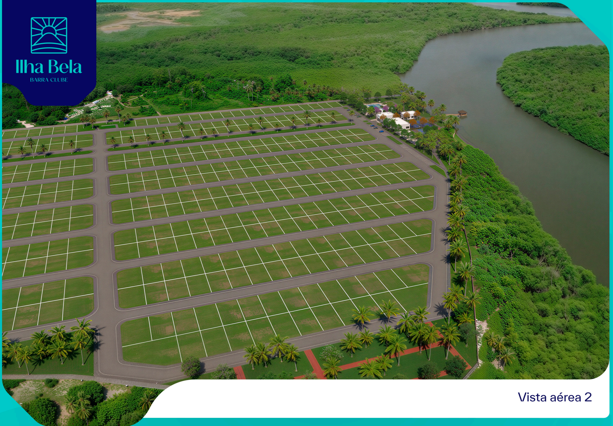
Vista aérea 2