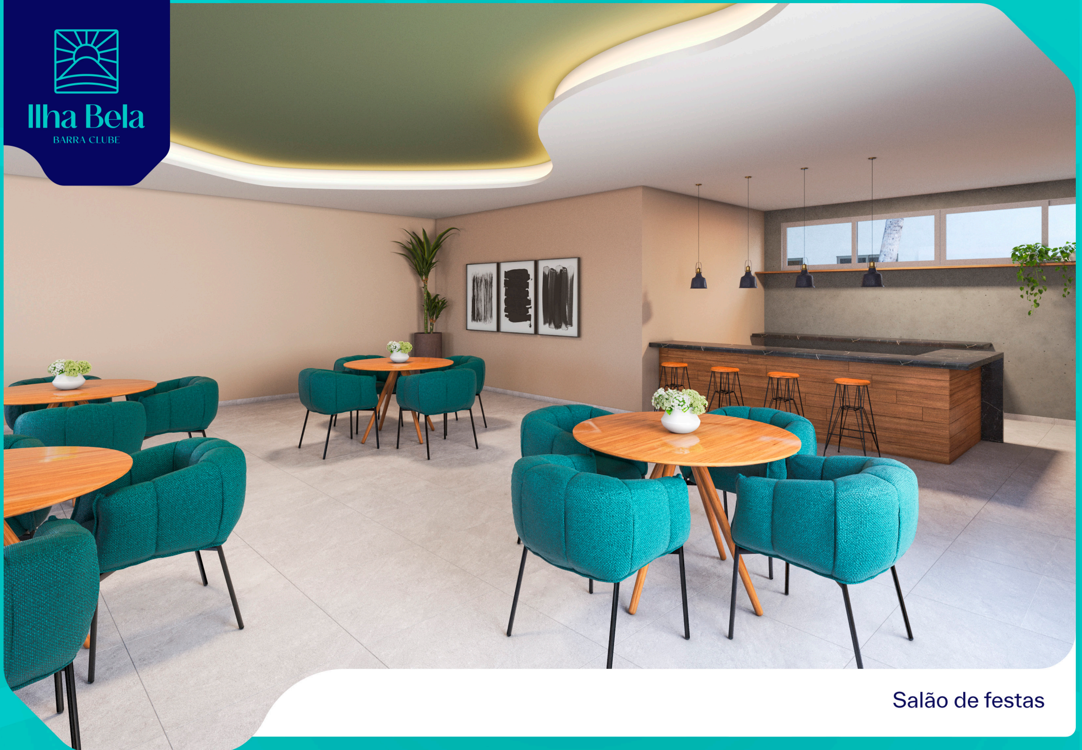
Salão de festas