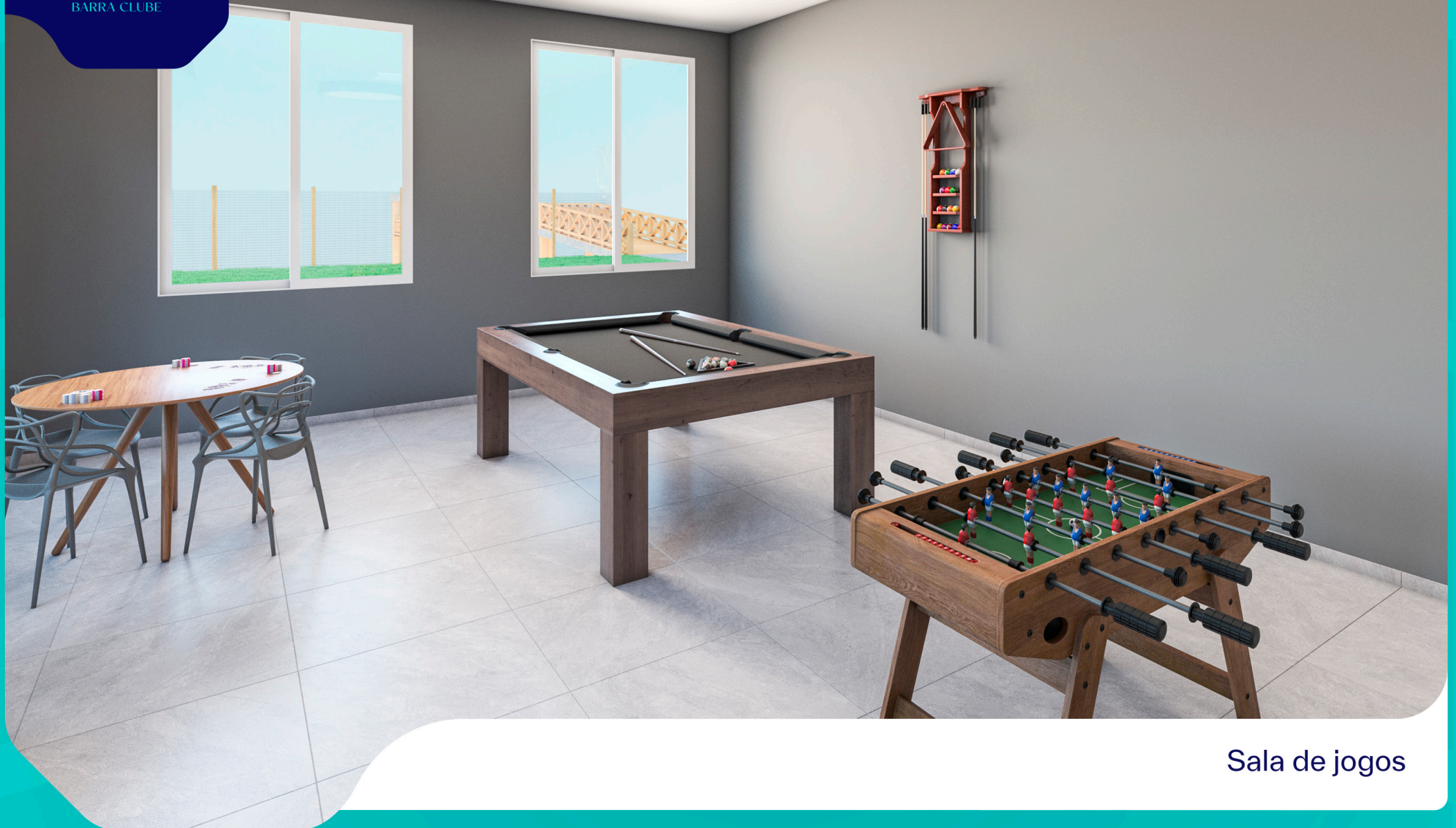
Sala de jogos