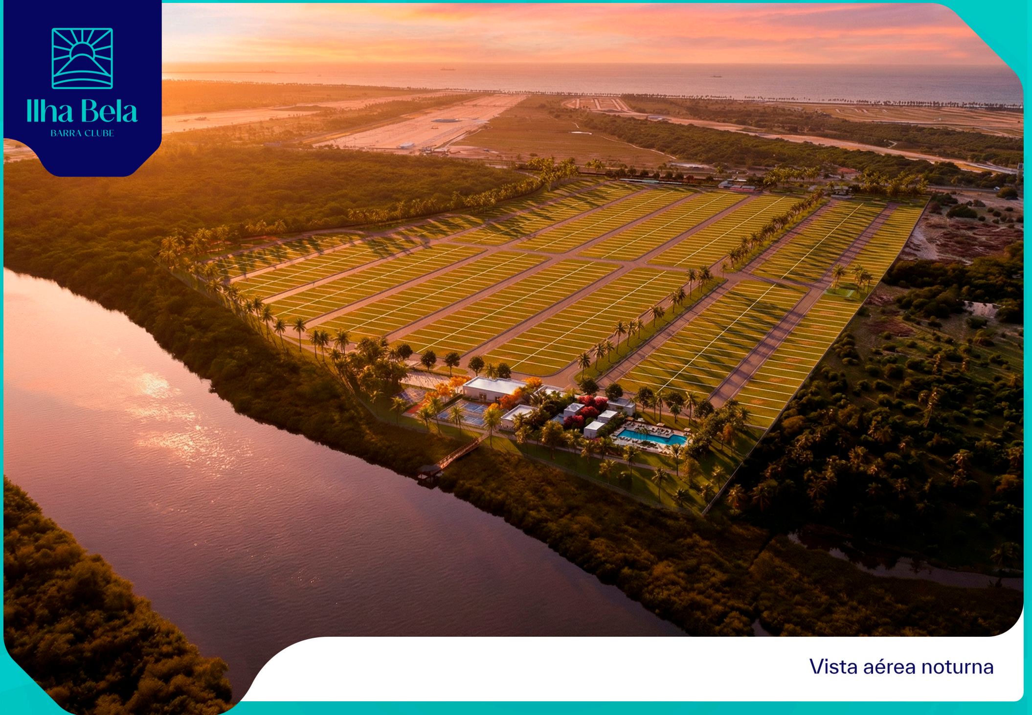
Vista aérea noturna