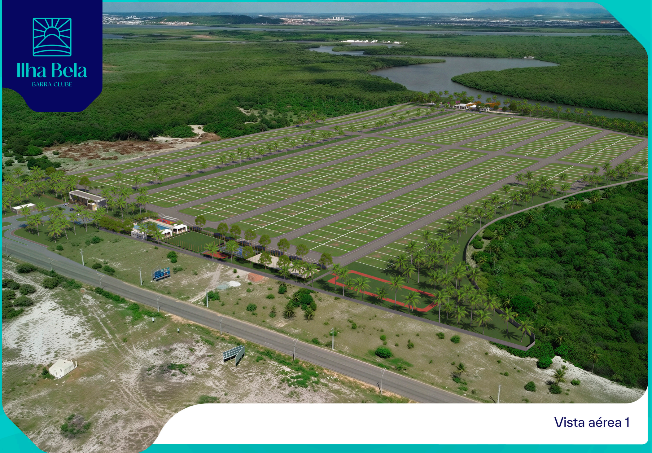
Vista aérea 1