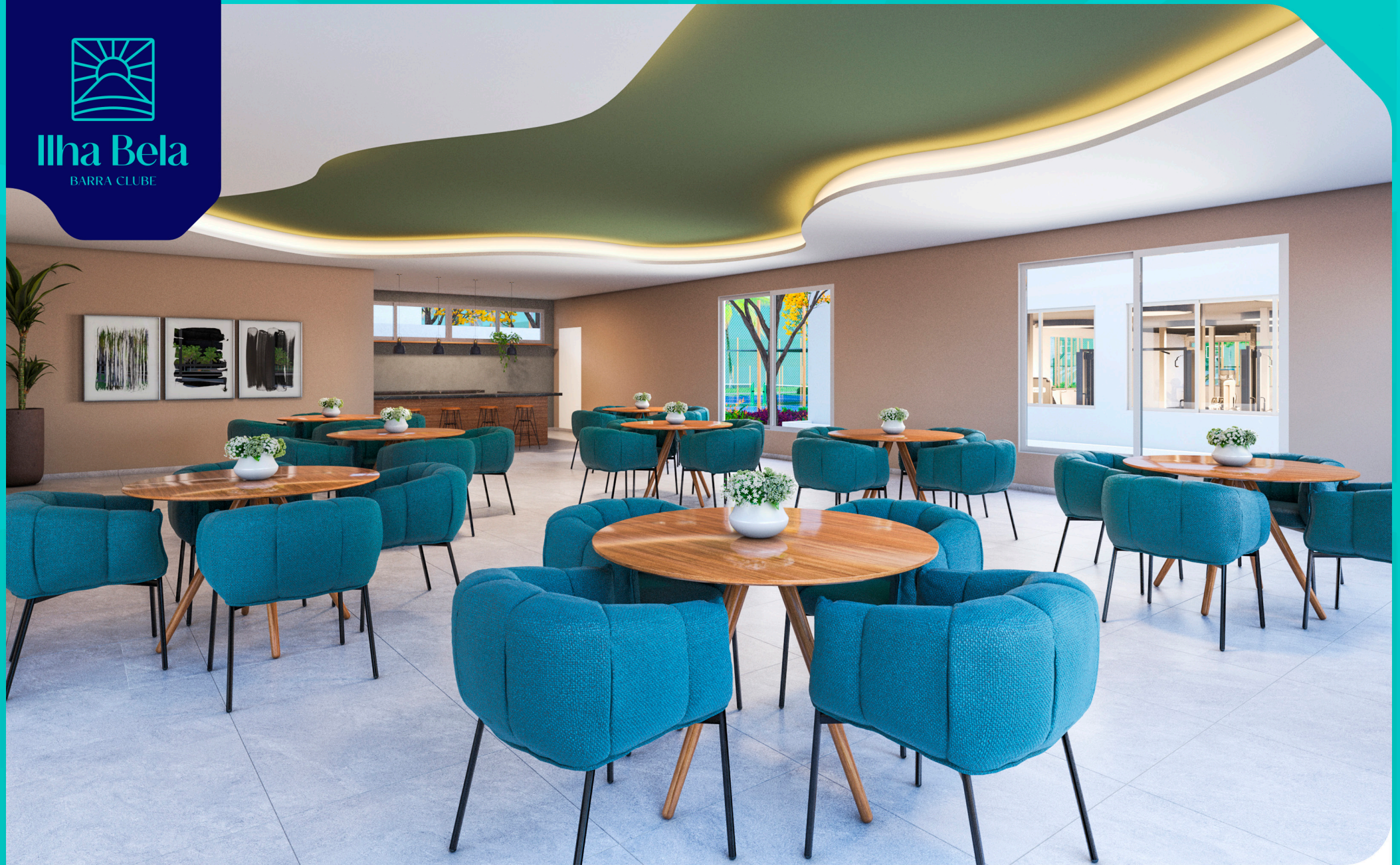
Salão de festas