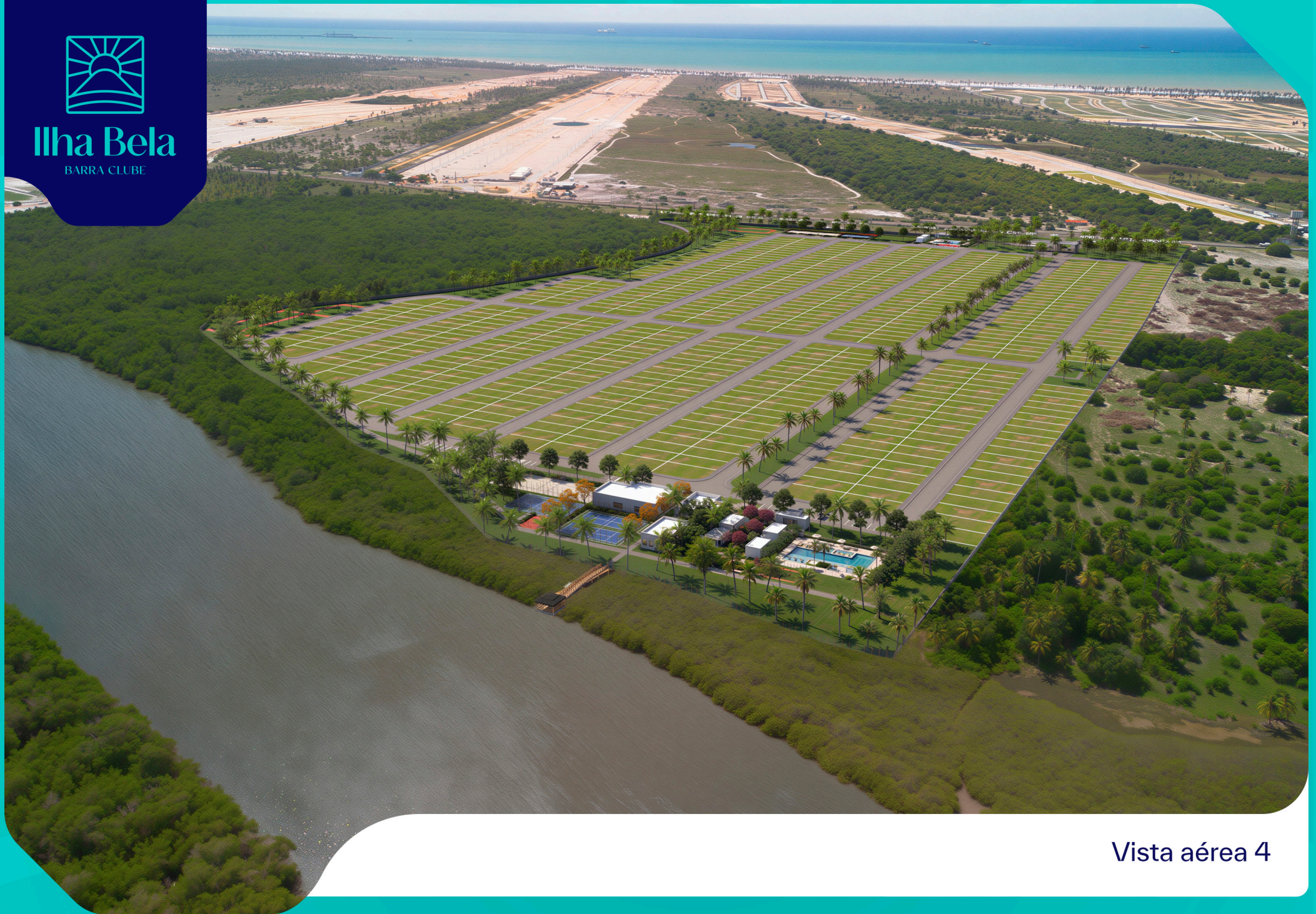
Vista aérea 4