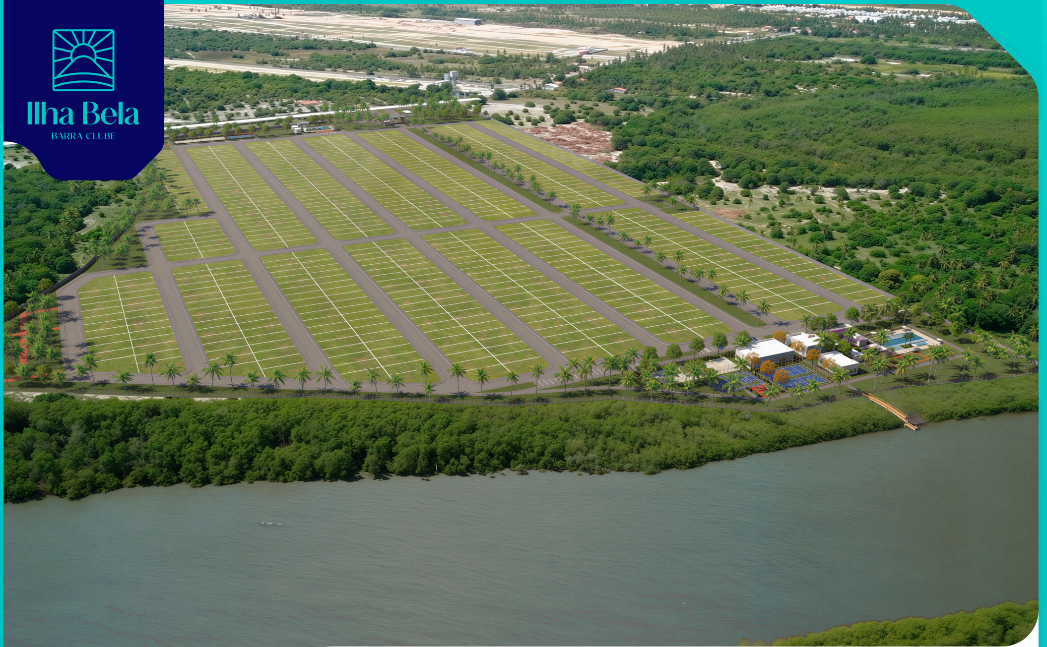
Vista aérea 3