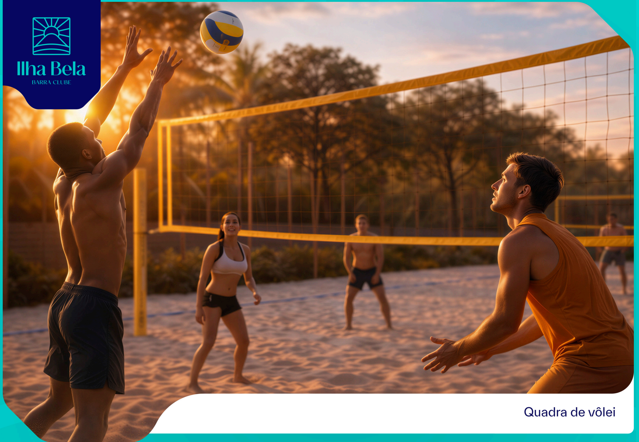
Quadra de vôlei