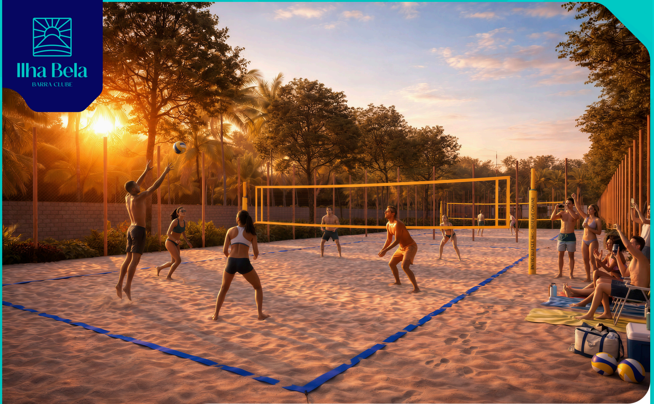
Quadra de vôlei