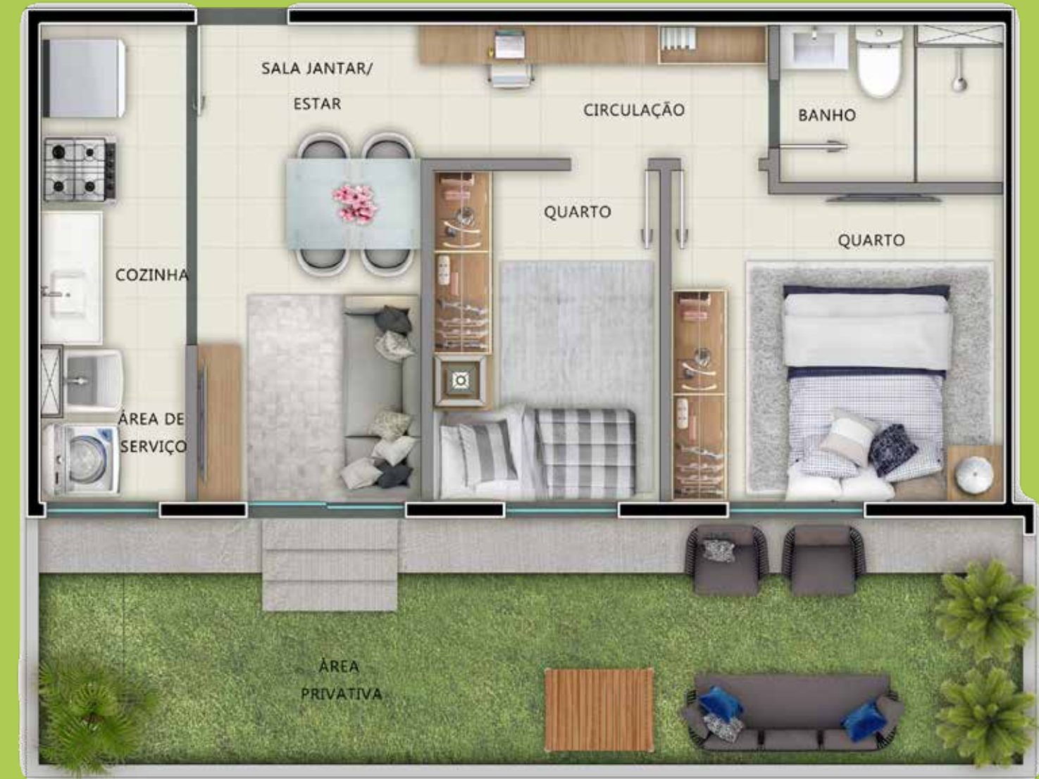
APTO. 105 - TORRE 02

Espaço e sossego não faltam. E nem um recanto pra chamar de seu.