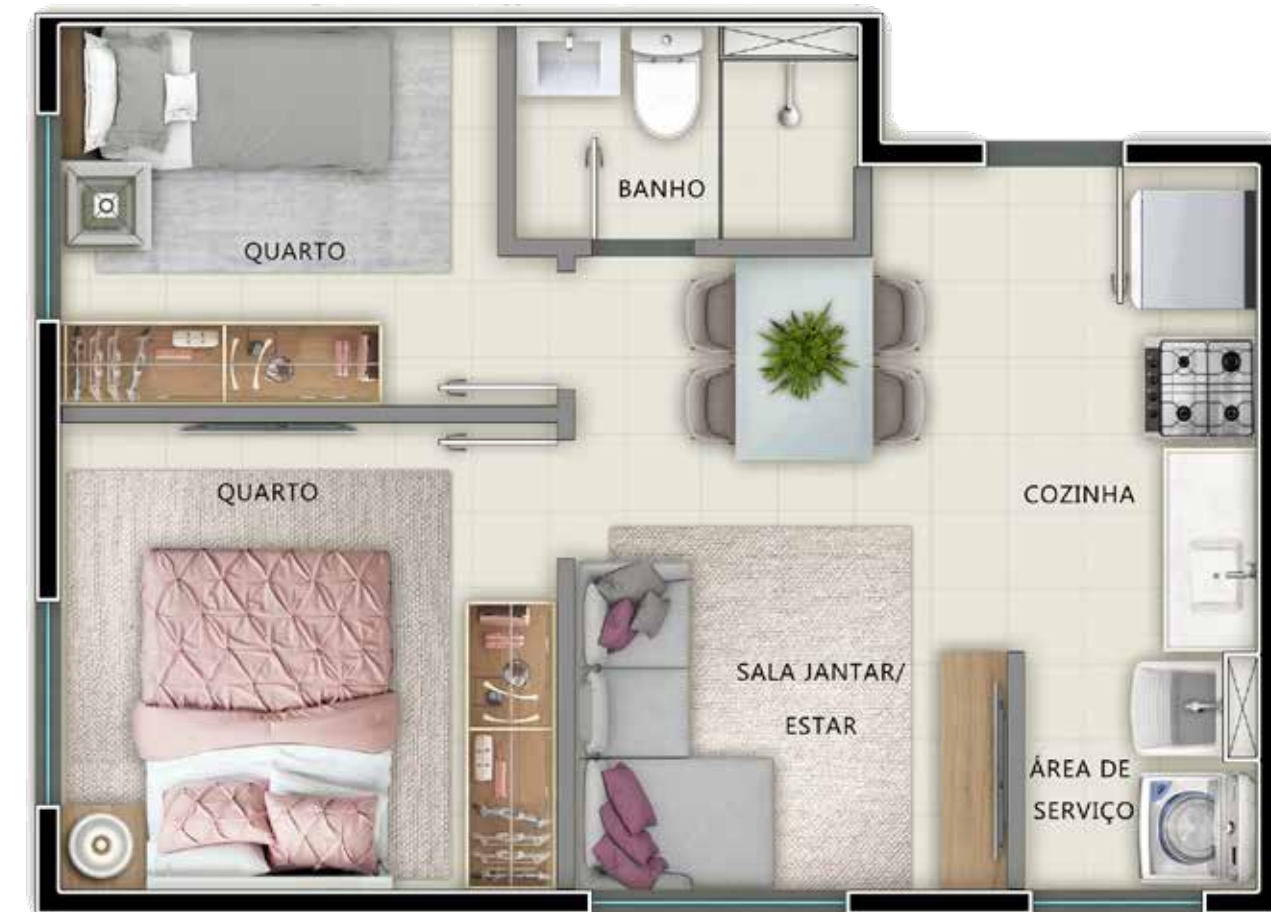
APTO. 406 - TORRE 02