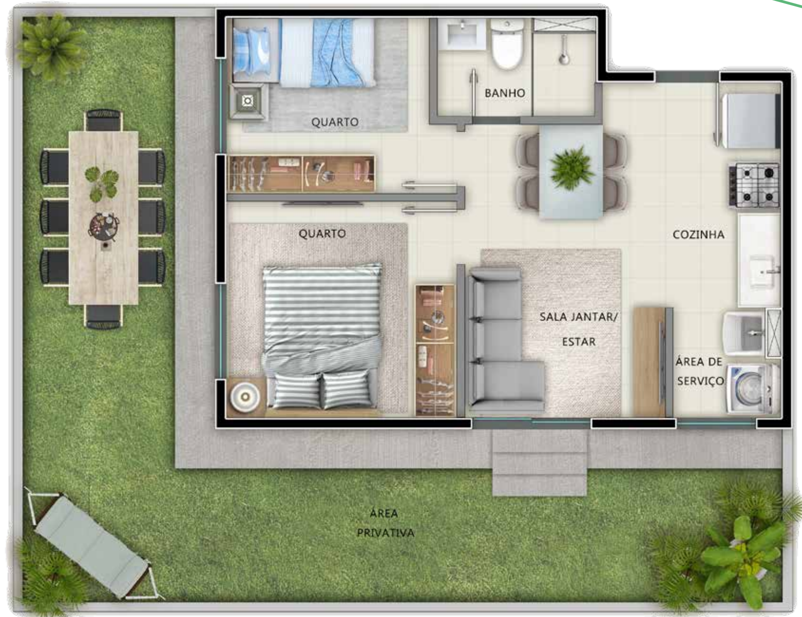
APTO. 106 - TORRE 02

Espaço e sossego não faltam. E nem um recanto pra chamar de seu.