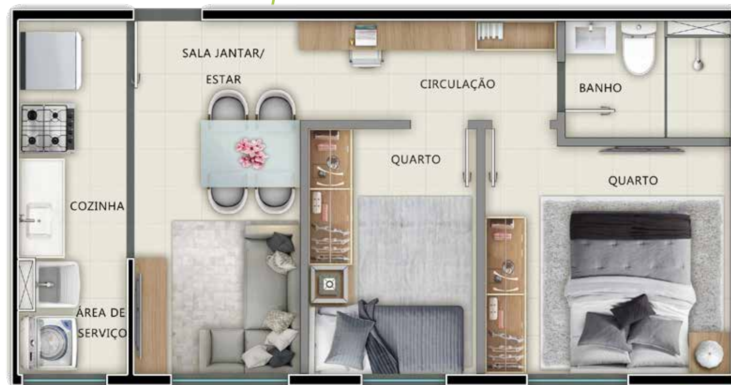
APTO. 405 - TORRE 02