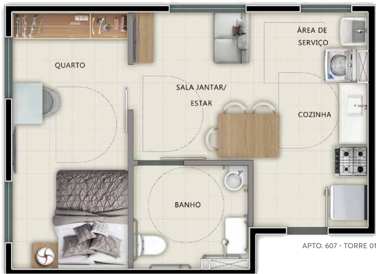
APTO. 607 - TORRE 01