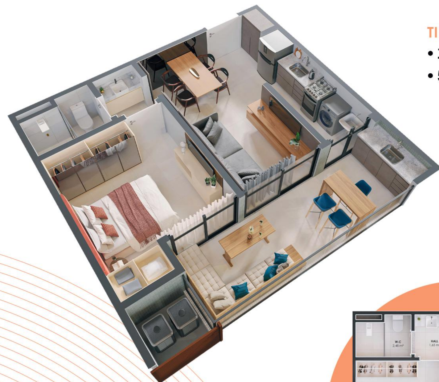
TIPO 01 • 1 QUARTO • 53,54m 2