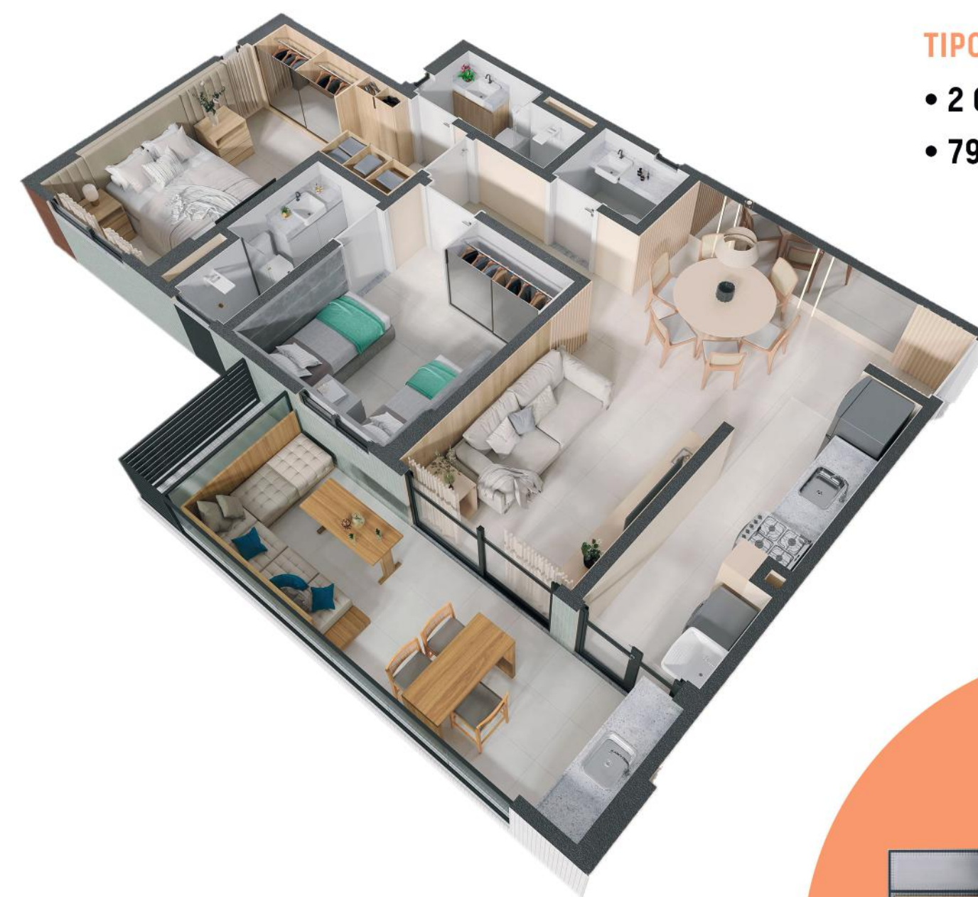
TIPO 02 • 2 QUARTOS SENDO 2 SUÍTES • 79,51m 2