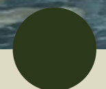
PISCINA COM BORDA INFINITA