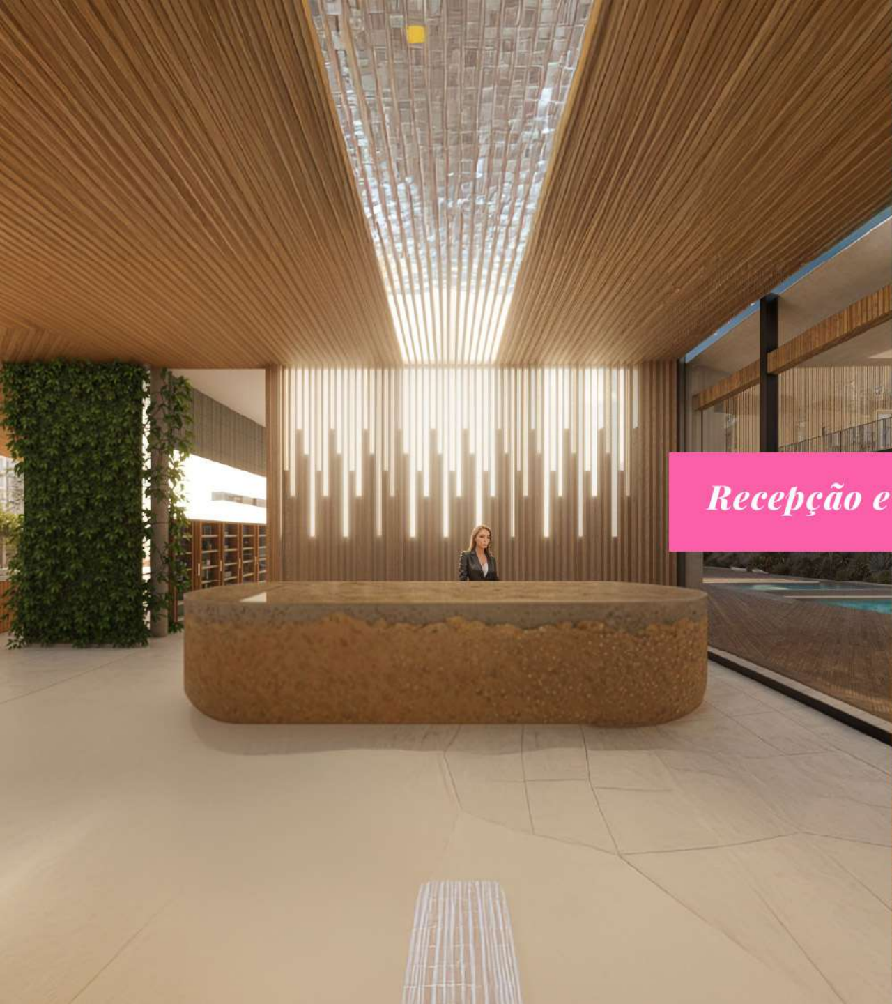
Recepção e lounge bar