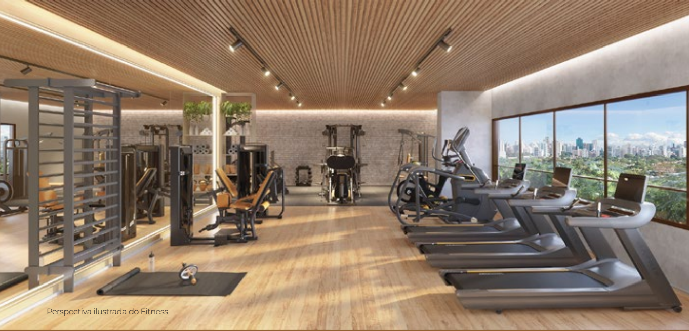
Perspectiva ilustrada do Fitness