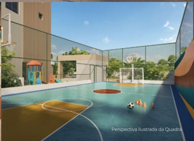
Perspectiva ilustrada da Quadra