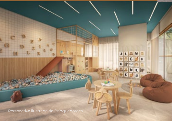
Perspectiva ilustrada da Brinquedoteca