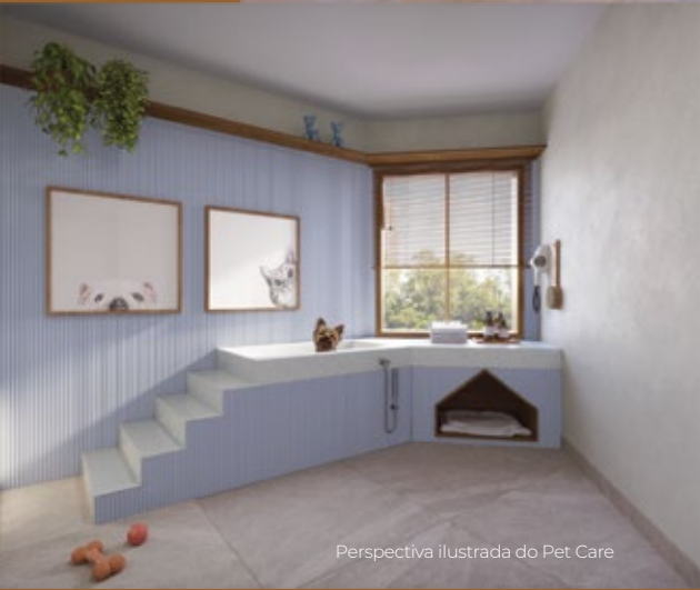
Perspectiva ilustrada do Pet Care