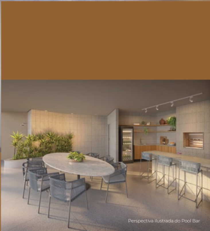
Perspectiva ilustrada do Pool Bar