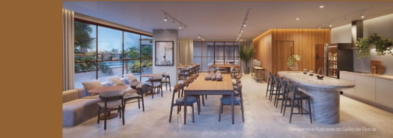
Perspectiva ilustrada do Salão de Festas