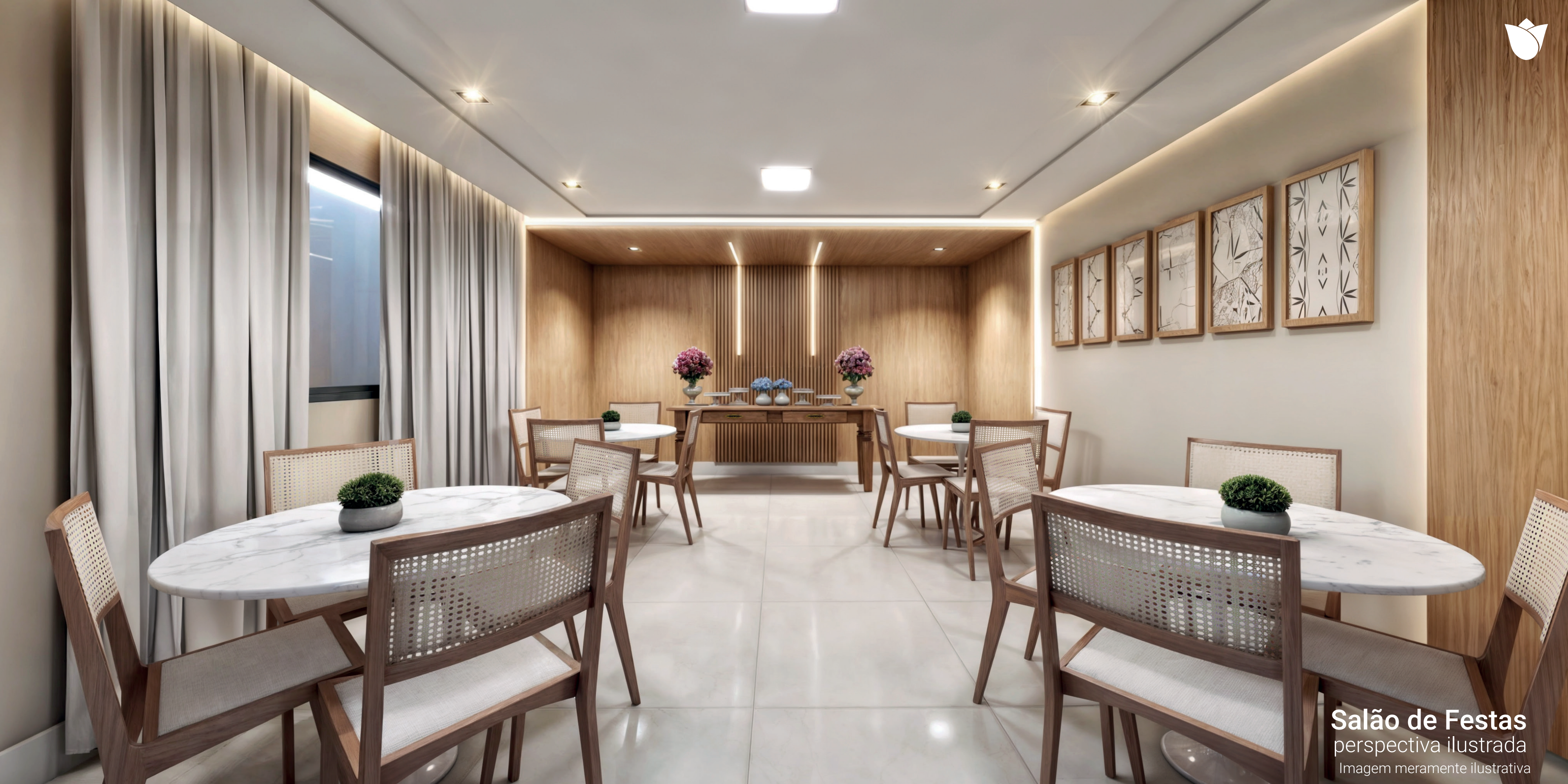
Salão de Festas perspectiva ilustrada Imagem meramente ilustrativa