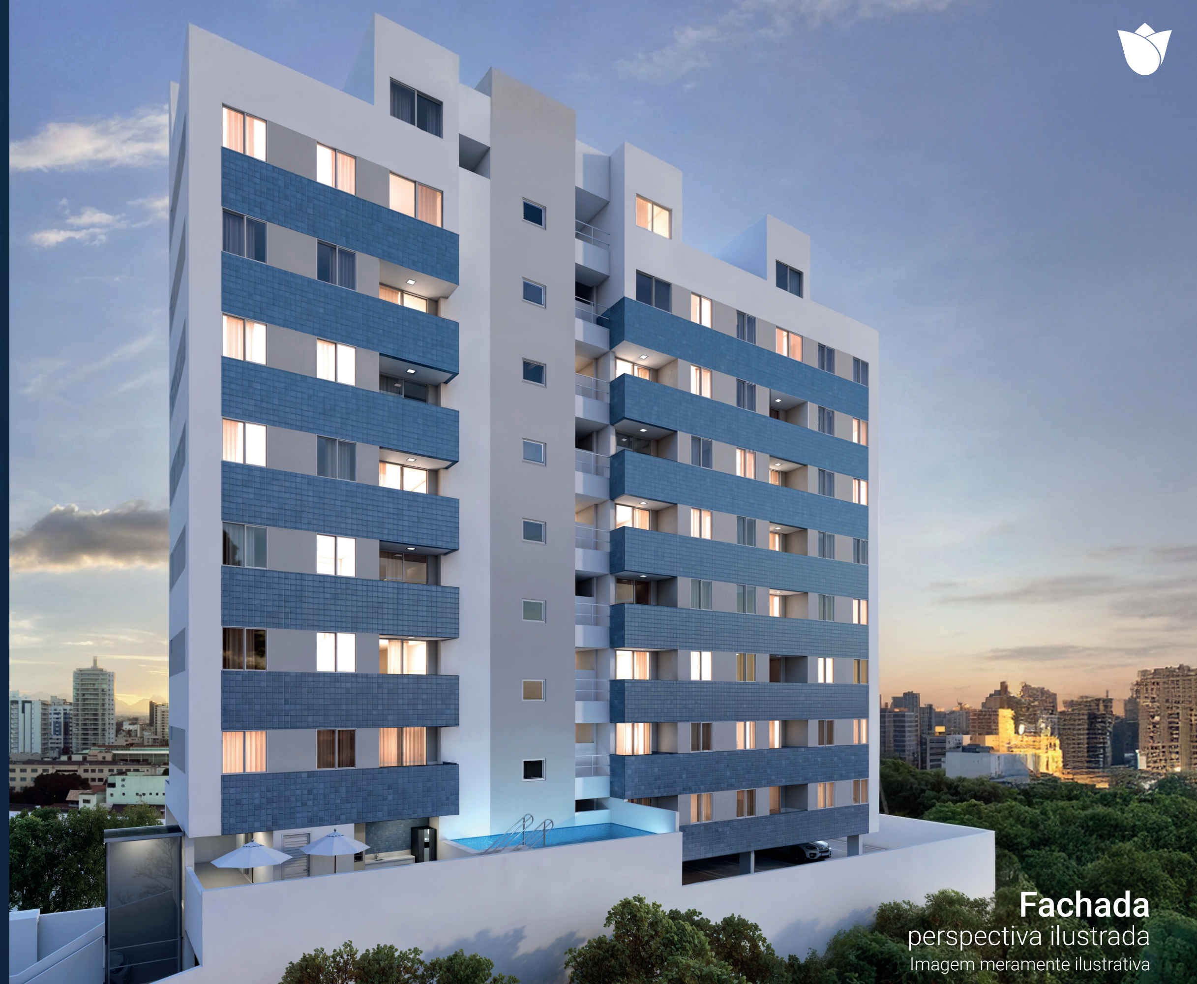
Fachada perspectiva ilustrada Imagem meramente ilustrativa

O projeto do Jardim das Tulipas, com apenas 03 apartamentos por andar, traz conforto e tranquilidade para quem mora aqui, além de uma estrutura que conta com piscina, churrasqueira e salão de festas.