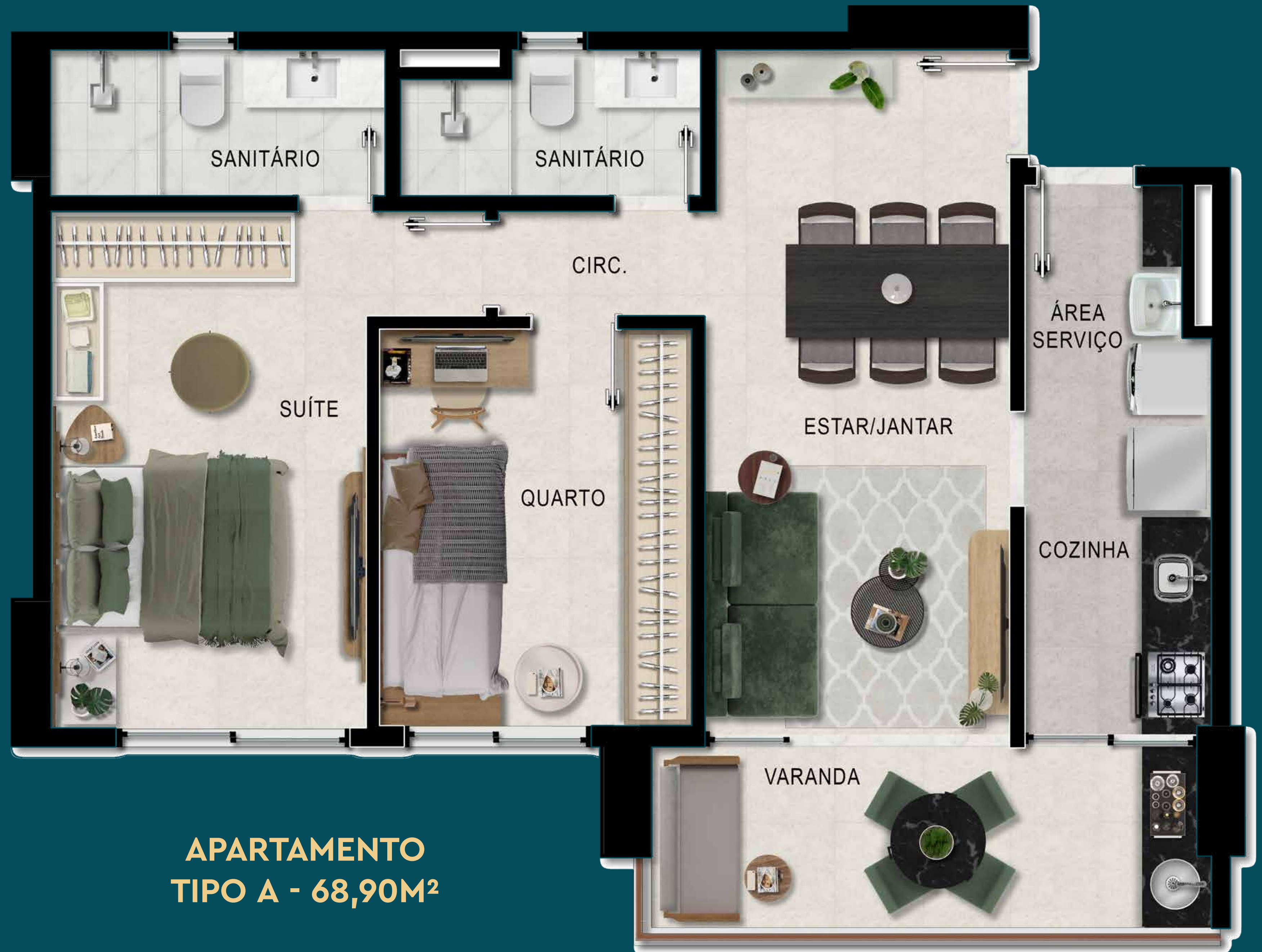
APARTAMENTO TIPO A - 68,90M 2

2 QUARTOS (SUÍTE) VARANDA GOURMET 2 VAGAS DE GARAGENS PISO EM TODOS OS AMBIENTES