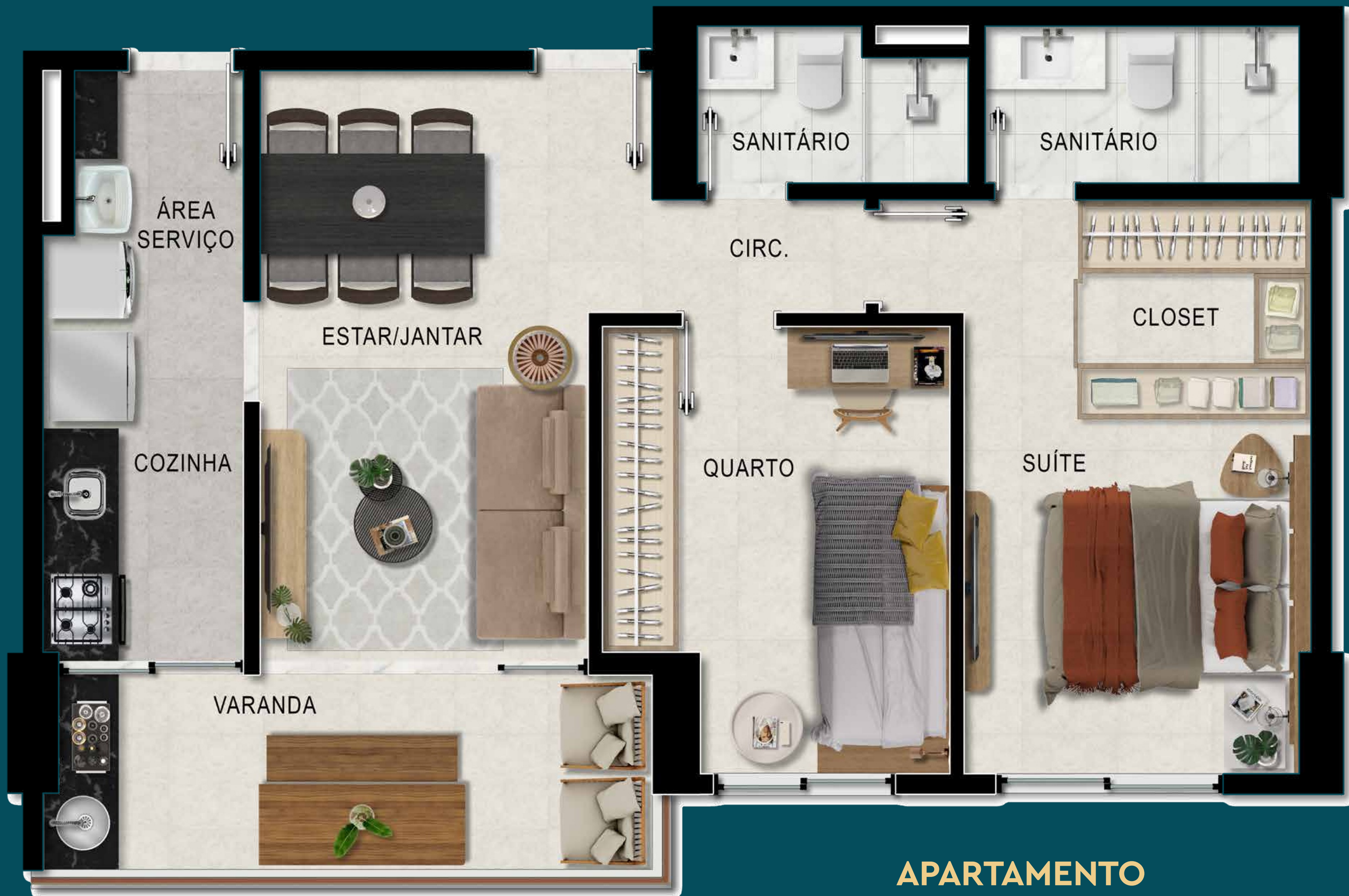
APARTAMENTO TIPO B - 65,23M 2