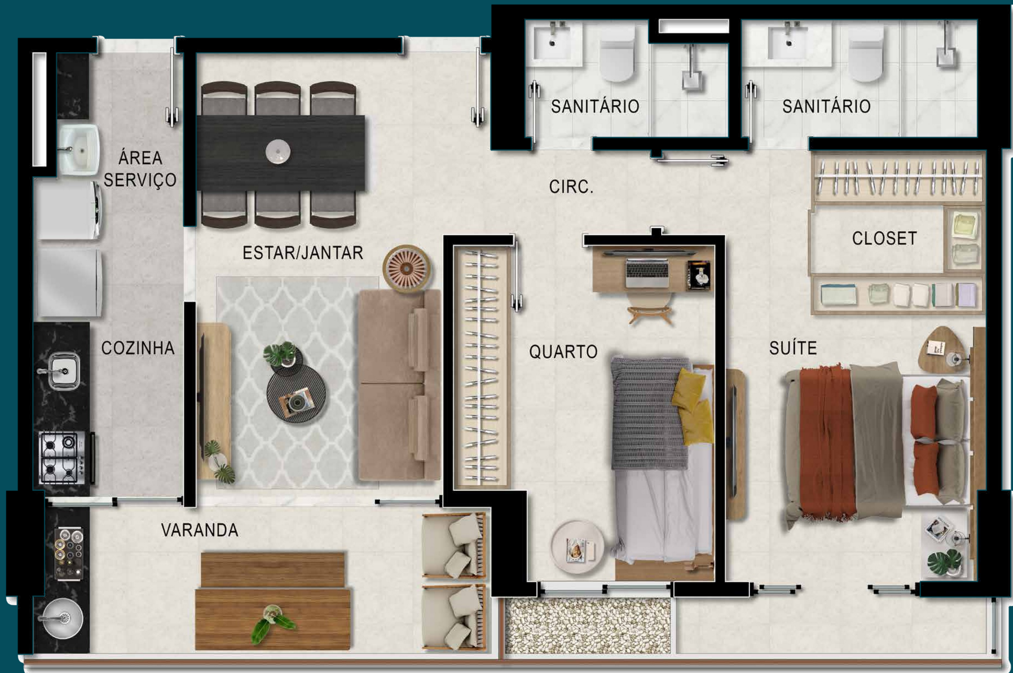
APARTAMENTO TIPO B1 - 69,07M 2