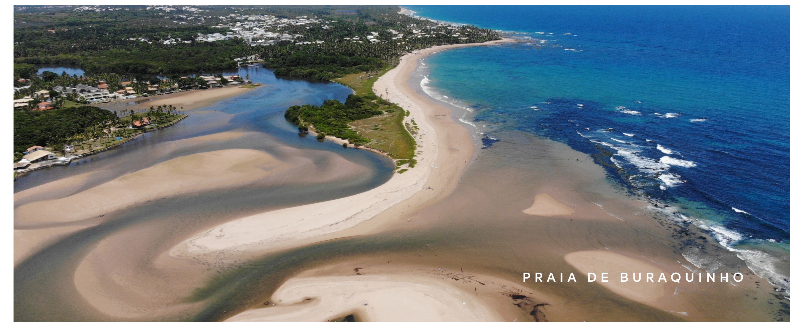
PRAIA DE BURQUINHO