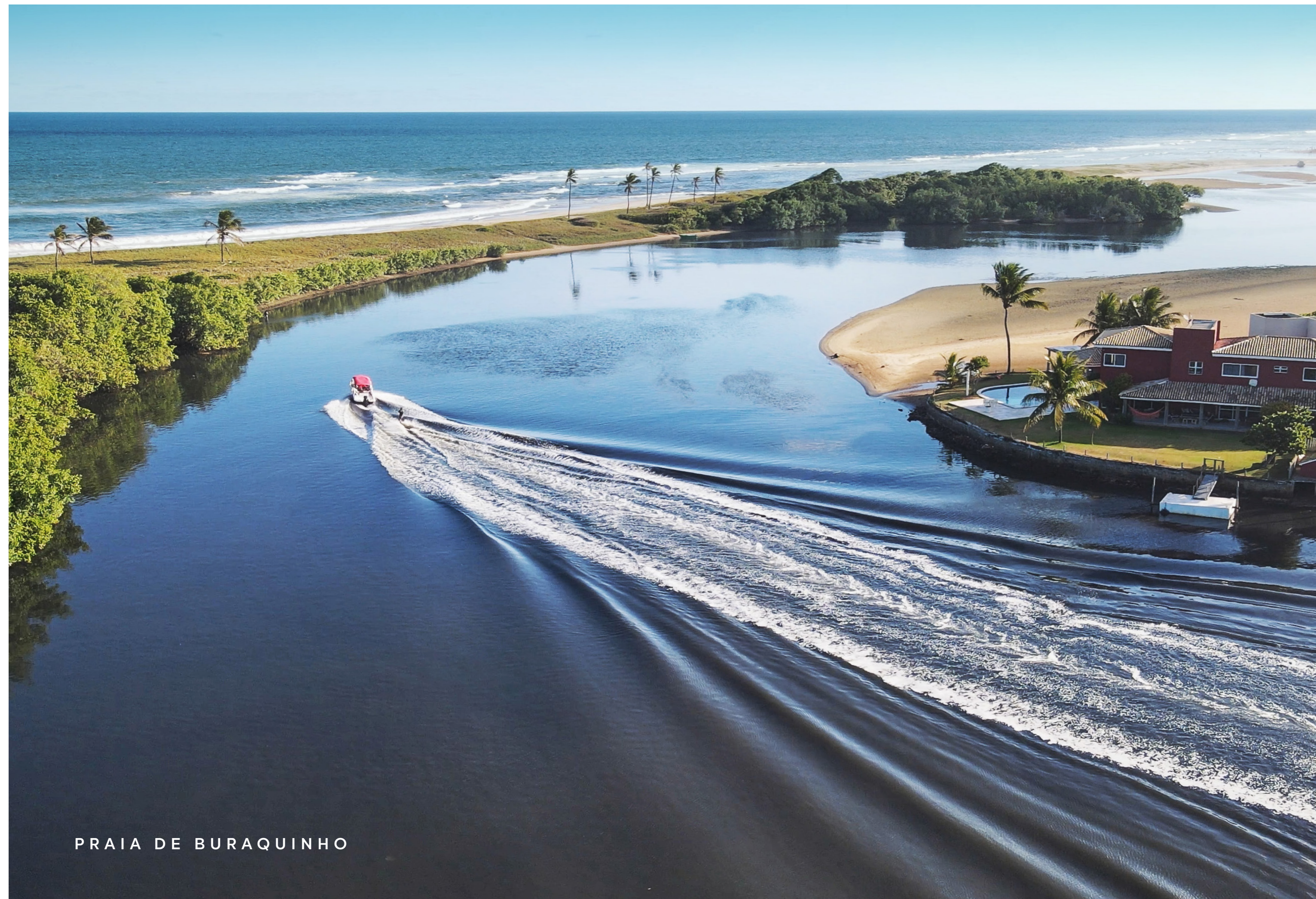
PRAIA DE BURQUINHO

A menos de 300 m da Praia de Buraquinho , com fácil acesso ao Litoral Norte e às melhores praias de Salvador.