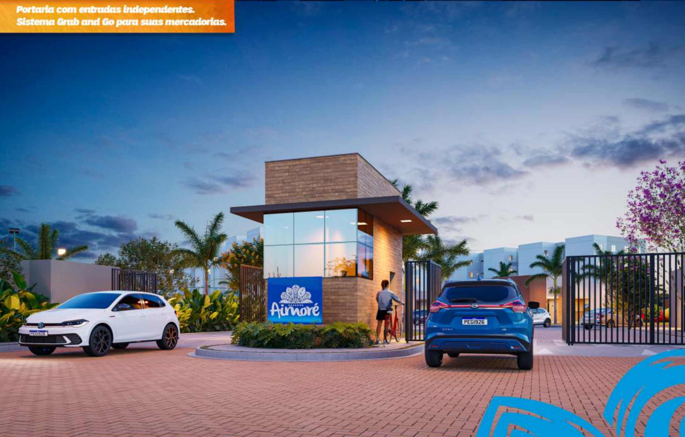
Perspectiva Ilustrada Portaria.

Portaria com entradas independentes. Sistema Grab and Go para suas mercadorias.