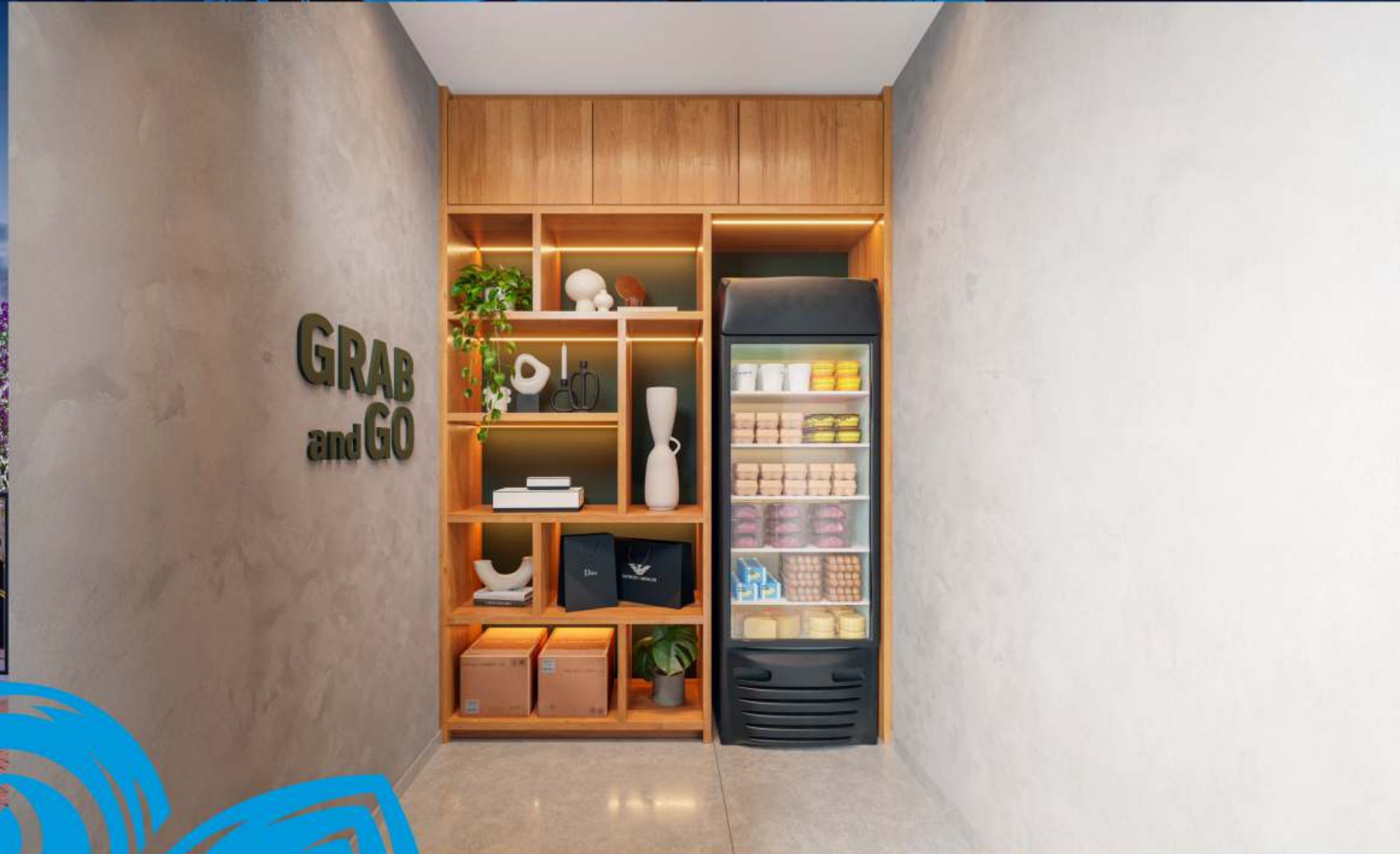
Perspectiva Ilustrada Grab and Go.