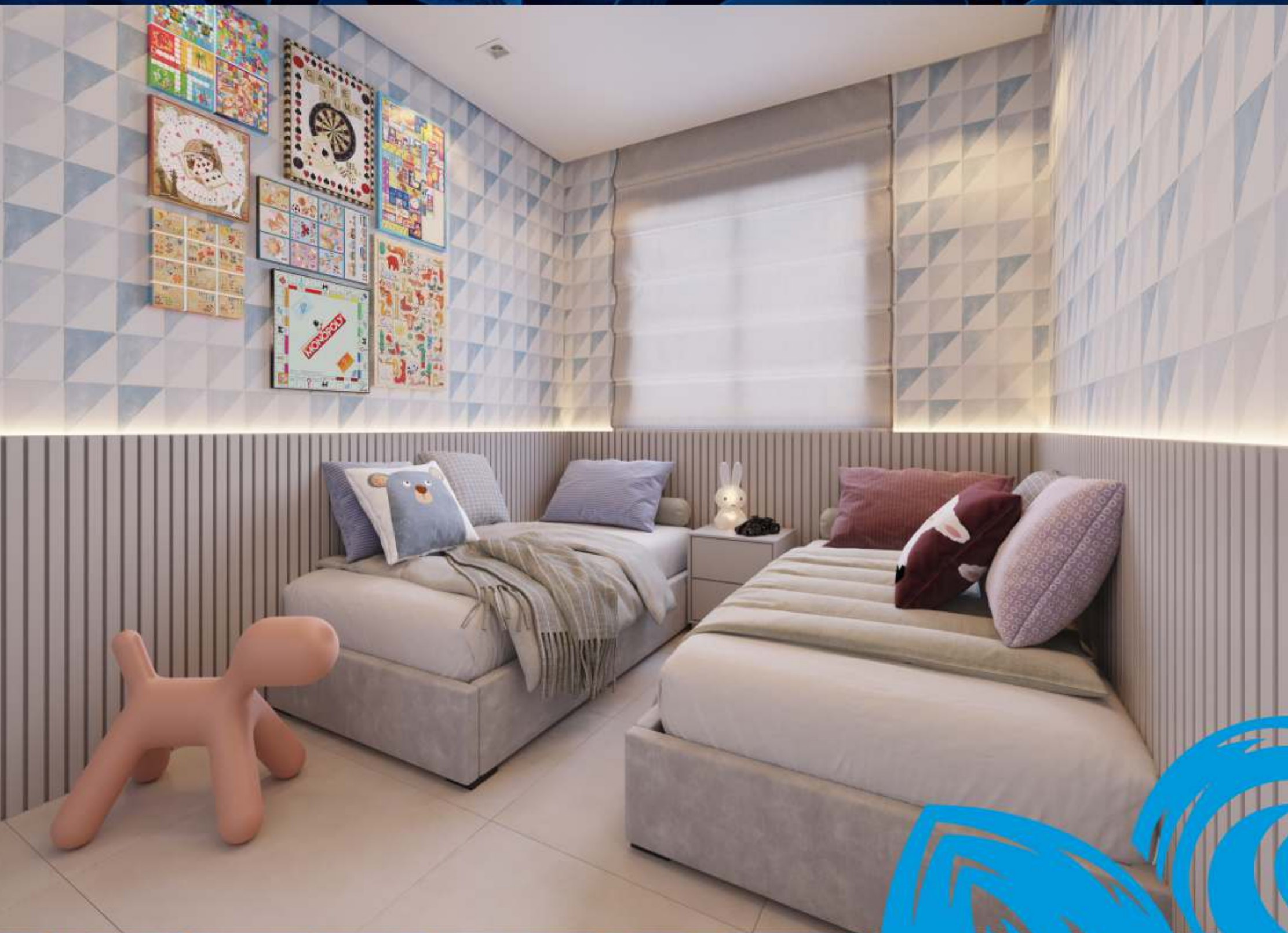
Perspectiva Ilustrada Quarto 01.