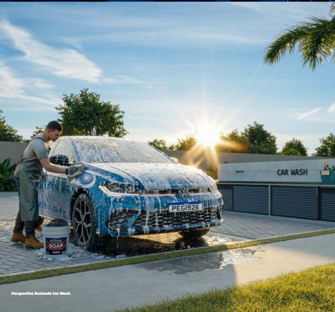
Perspectiva Ilustrada Car Wash.

Carregamento de veículo elétrico, a tecnologia que o mundo precisa.