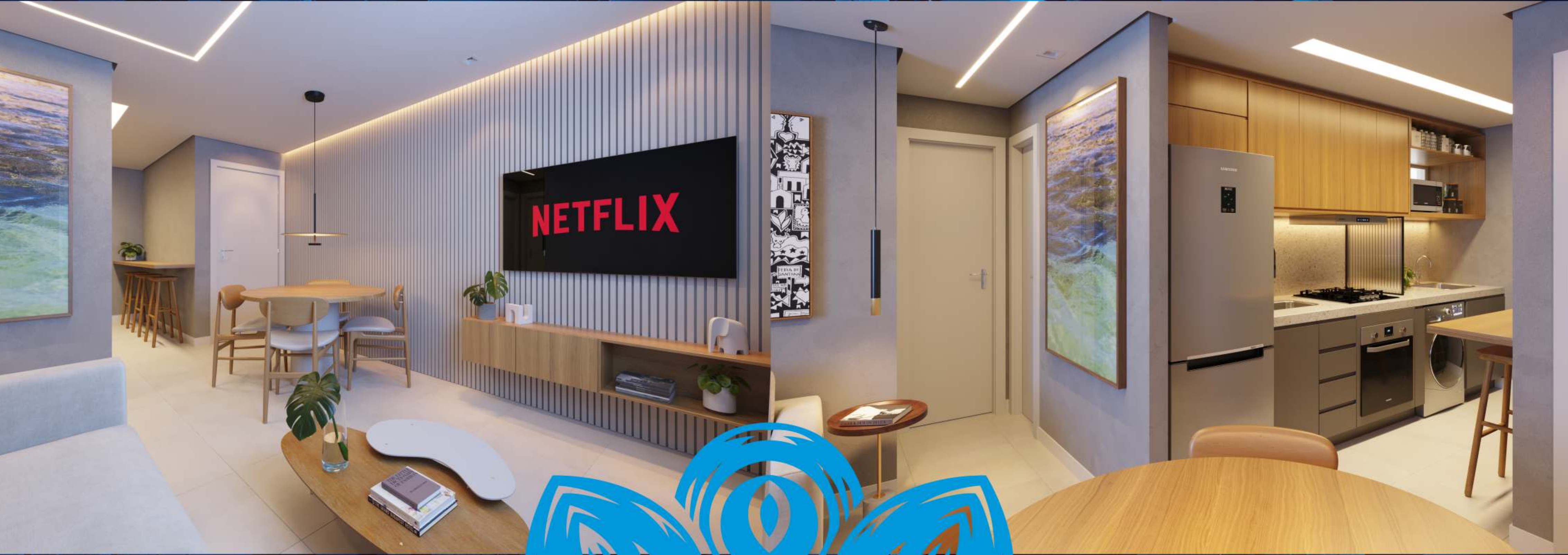
Perspectiva Ilustrada Sala.