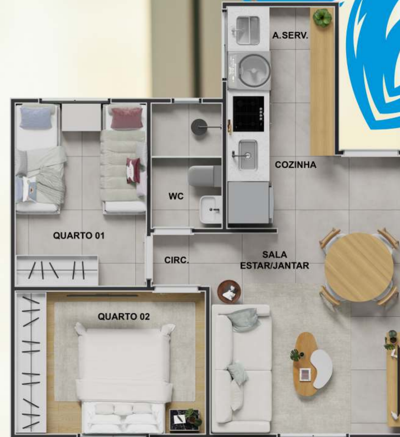
Planta unidade padrão.