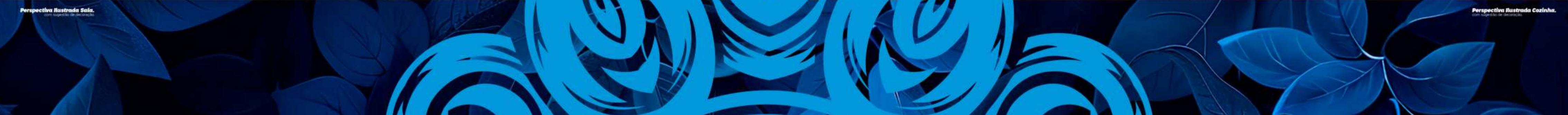
Perspectiva Ilustrada Cozinha.