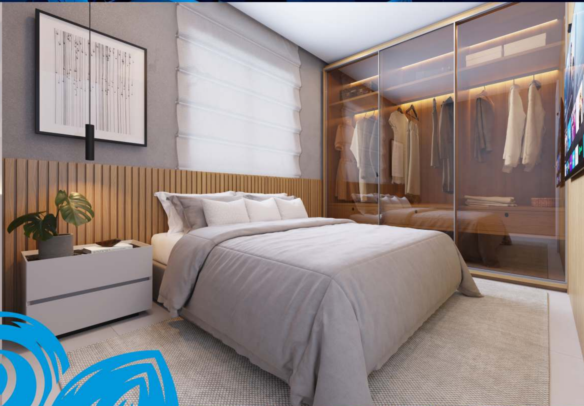
Perspectiva Ilustrada Quarto 02. © 2021 Arquitetura de Interiores