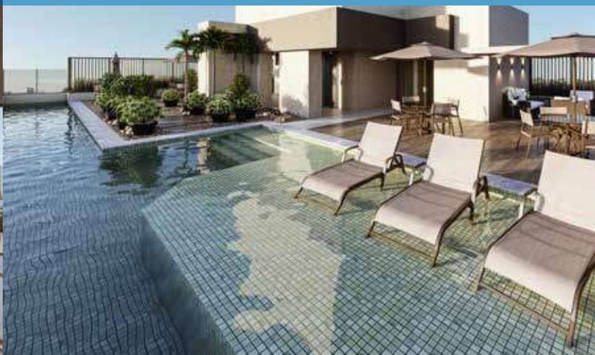
PISCINA COM DECK MOLHADO E RAIA 22m