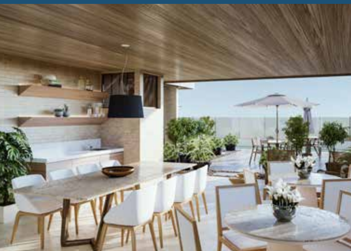
TERRAÇO RELAX - APOIO DA PISCINA